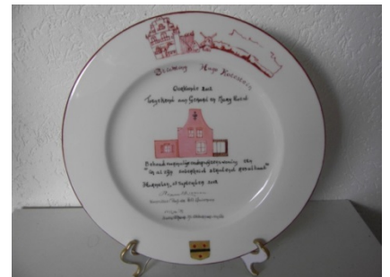
De nieuwe oorkonde