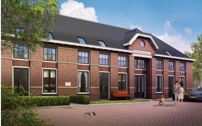
Schetsplan Timotheïsschool 2013

Einde 2012 kwamen de eerste schetsen naar buiten. De werkgroep is te spreken over de wijze waarbij het historisch karakter van de voorgevel hierbij wordt behouden.