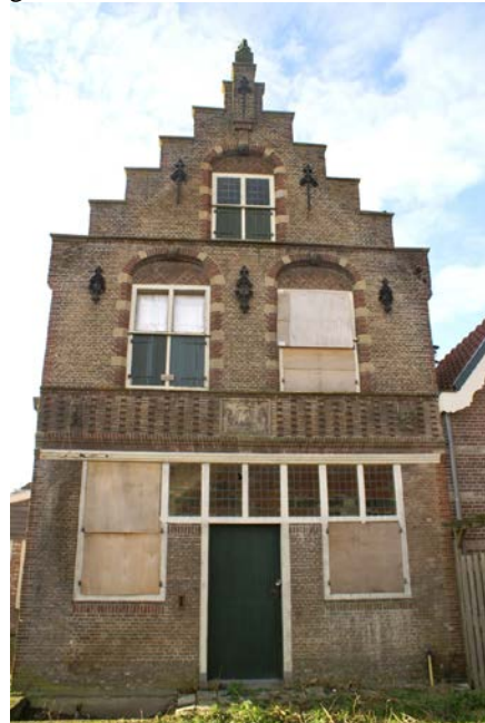
Lange Burchwal 61 een beeldbepalend pand in verval

Met name voor het pand het pand Lange Burchwal 61 dringt de tijd. De werkgroep maakt zich hierover grote zorgen vanwege het achterstallige onderhoud waardoor het pand verloren dreigt te gaan. Het is van groot belang om dit cultureel erfgoed voor de toekomst veilig te stellen. Dit kan door dit object een bijzondere waarde toe te kennen d.m.v. plaatsing op de monumentenlijst. Wij betreuren het dat dit nog steeds niet is gebeurd.