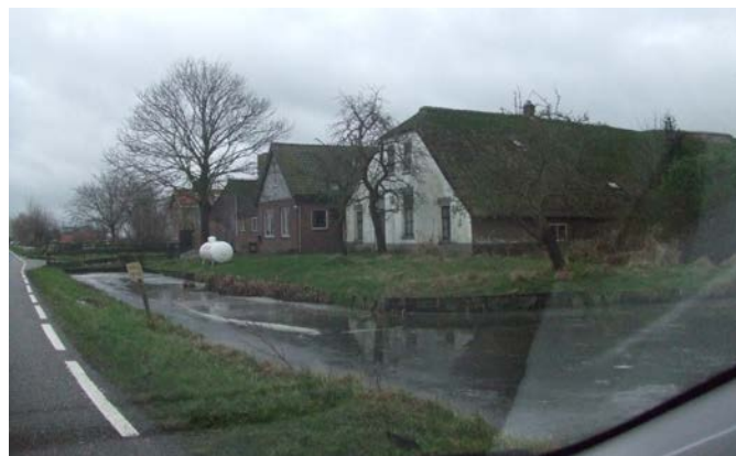
Foto's van de boerderij Oukoopsedijk 10 te Reeuwijk