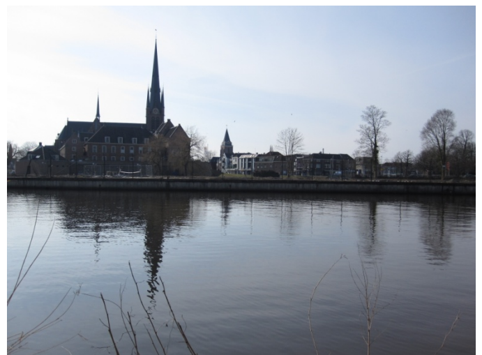
Zicht op Bonaventurakerk en Kasteel vanaf de Stationsweg

De werkgroep heeft op 13 september ingesproken in de vergadering van de Commissie Ruimte, wij hebben opnieuw gevraagd de hoogbouw uit het plan te halen.