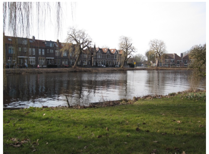
Zicht op de Zandwijksingel

Voor het dempen van de strook water is een omgevingsvergunning en een wijziging van het bestemmingsplan nodig. In een gesprek heeft Stichting Hugo Kotestein aan het gemeentebestuur laten weten grote moeite te hebben met het versmallen van de vestinggracht, maar geen zienswijze te zullen indienen. Op haar beurt heeft de gemeente toegezegd Stichting Hugo Kotestein in een vroeg stadium te betrekken bij andere plannen in het singelgebied rond de binnenstad.