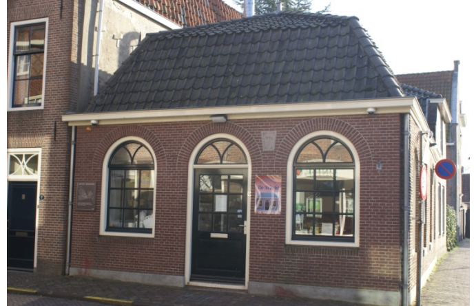
De Wacht binnenkort ook op de monumentenlijst?

De oude school (Rijksmonument in de Kapellestraat) was voorheen een openbare school, gebouwd in 1882 in de neorenaissance stijl naar een ontwerp van architect Van Wijngaarden. De school heeft achterstallig onderhoud en moet gerenoveerd worden. De werkgroep heeft de wethouder diverse malen gevraagd de restauratie ter hand te nemen. Omdat het de gemeente aan middelen ontbrak, heeft de wethouder J.W. van Wijngaarden een concept bedacht waarbij aan particulieren is gevraagd een herbestemmingplan voor dit Rijksmonument te maken en bij de gemeente in te dienen. Uit tien voorstellen is het plan gekozen dat een goede restauratie en onderhoudsgarantie biedt, waarbij het gebouw zo min mogelijk aangetast zal worden. Het plan 'Muziekhuis Oudewater', mag de herbestemming van de Oude School in 2013 in praktijk brengen. Wij vertrouwen erop dat Oudewater met deze nieuwe bestemming een goede keuze gemaakt heeft.