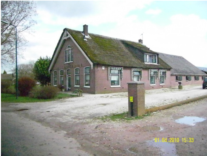
Reijerscop 27 voor de sloop en herbouw