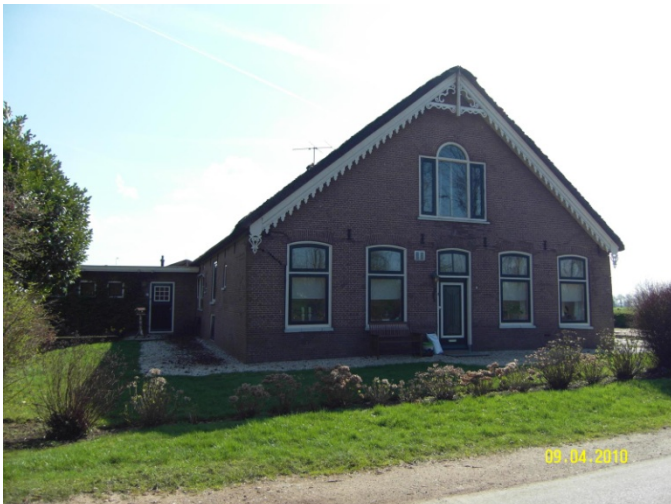
Voor de sloop en herbouw

De eerste twee foto's geven een beeld van de rechterzijde van de langhuisboerderij Reijerscop 27, namelijk het pand in 2010 voor de sloop respectievelijk het pand in januari 2013 na de herbouw.