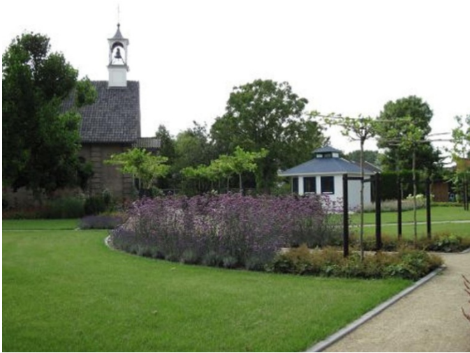
St. Bavo Kapel oude situatie met klokkenstoren

Op het zadeldak is een dakruiter (torentje) geplaatst waar in het verleden een klokkenstoel met luidklok is aangebracht.