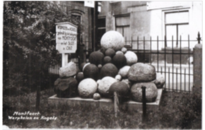
De stapel werpkieën zoals deze voor het Stadhuis lag.

De werkgroep heeft bij de gemeente Montfoort haar zorgen uitgesproken over het steeds minder wordende aantal werpkieën, welke min of meer openbaar liggen in de Commanderijetuin. De gemeente heeft een onderzoek ingesteld en heeft beloofd maatregelen te treffen.