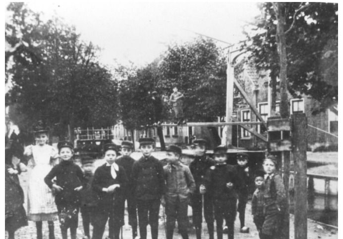
Dorpsbrug met op de achtergrond de kerkbrug te Kamerik.

Per ultimo 2012 hadden wij nog geen formeel antwoord op ons aanbod ontvangen.