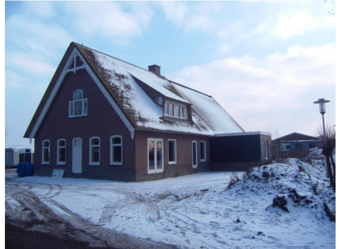
..... na de sloop en herbouw