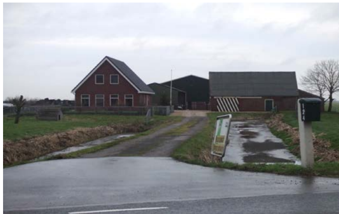
Noordzijde 124 te Bodegraven huidige situatie