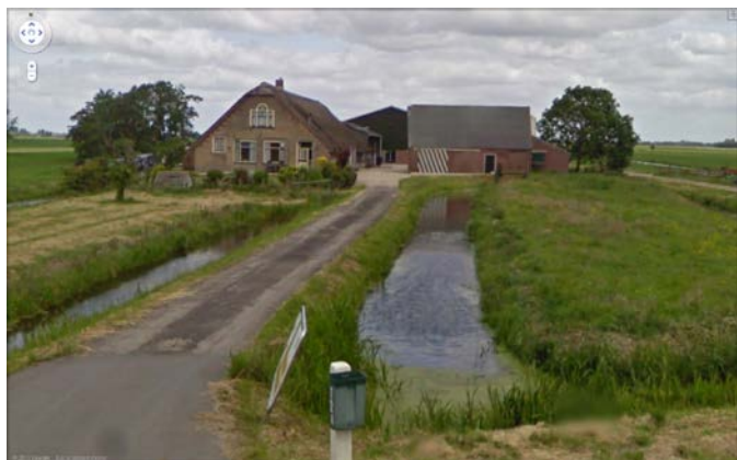
Noordzijde 124 te Bodegraven voor de sloop