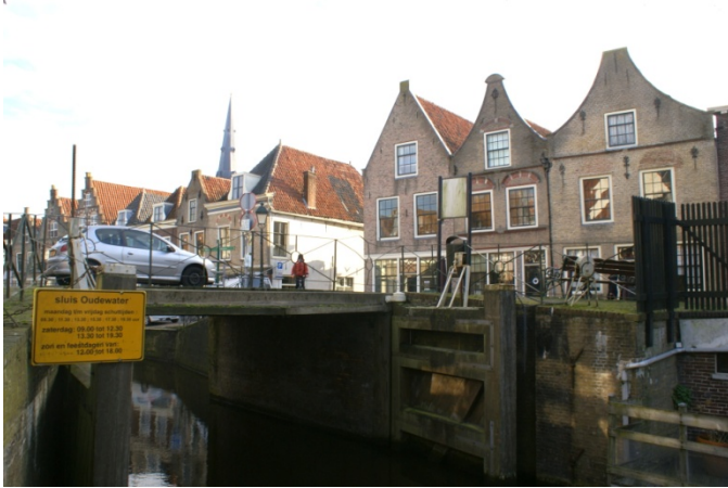
Romeijnbrug in 2016 weer een boogbrug