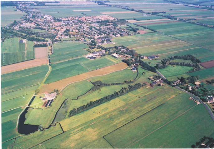
De Linie van Linschoten