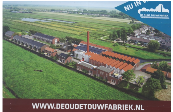
Bouwproject oude touwfabriek Van der Lee

De werkgroep Hugo Kotestein vindt dit een goed voorbeeld van woningbouw waarbij het monumentale karakter van de omgeving en de structuur van de oude fabriek behouden blijft en gerestaureerd wordt.