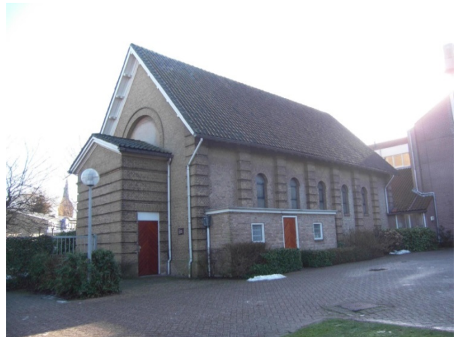
St. Bavo Kapel nieuwe situatie zonder klokkenstoren

Met het weghalen van het torentje, kenmerkend element van de Kapel is het Gemeentelijk Monument ernstig verminkt.