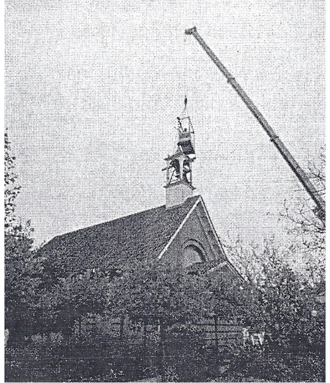
Klokkenstoren van St. Bavo wordt verwijderd

Op 24 oktober 2012 is in opdracht van de eigenaar Zorggroep St. Maarten afd. Gaza de klokkenstoren verwijderd zonder vergunning en buiten medeweten van de gemeente Woerden.