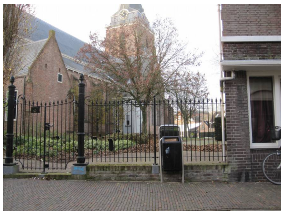
Nieuwe plaats voor Gildepoortje ?

De gemeente zoekt al een poos naar een geschikte plek voor het Gildepoortje, stammend uit de 16 de eeuw. Stichting Hugo Kotestein denkt mee. Het afgelopen jaar heeft de werkgroep een rondgang gemaakt door de binnenstad, daarbij zijn veel plekken bekeken waar het poortje zou kunnen komen. In de binnenstad zijn veel stegen, het Gildepoortje zou de toegangspoort tot één van deze stegen kunnen zijn. Maar steeds was er iets waarom dat niet kon. Er bleven nog drie plekken over: tussen Pompier en Petruskerk, in de Romeinsteeg en in de Havenstraat tussen Museum en Mariaschool. De laatste optie heeft de voorkeur van de werkgroep. In een tekening is dit uitgewerkt en aan de gemeente gezonden. In 2015 wil de gemeente de knoop doorhakken en een definitieve plek aanwijzen voor het Gildepoortje.