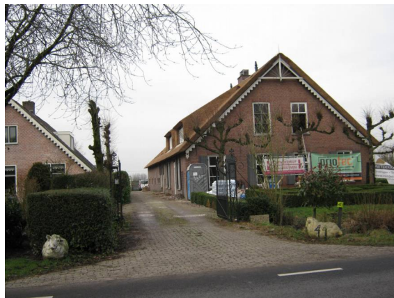
Breudijk 41 - Deze boerderij zal worden veranderd in vier woningen.

Breudijk 47: Realiseren van een overkapping.