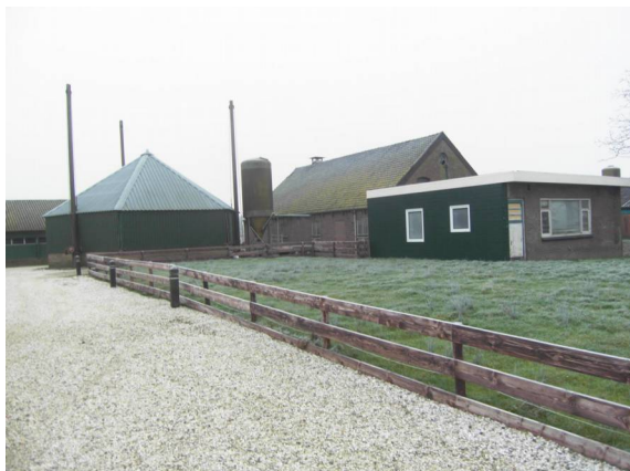
Reijerscop 35: Huidige situatie. Op de plaats van het vroegere monument bevindt zich nu een grasveldje.

Na de uitspraak door de Raad van State kan de gemeente tegen dergelijke verwaarlozing handhavend optreden en eigenaren bijvoorbeeld dwingen om een pand wind- en waterdicht te maken.