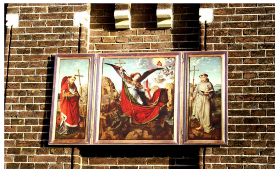
Het schilderij Davids

De Stichting verwacht dan ook medewerking te zullen vinden bij de instanties (gemeente en de politieke partijen) om haar doelstellingen de komende jaren te kunnen verwezenlijken.