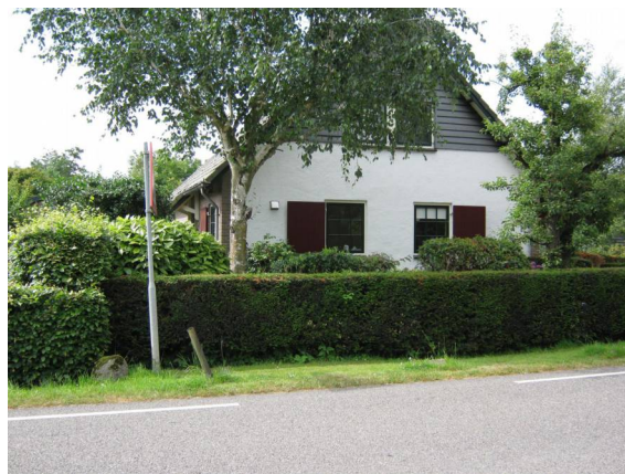
Breudijk 40: Dit pand zal worden gesloopt voor nieuwbouw twee appartementen.