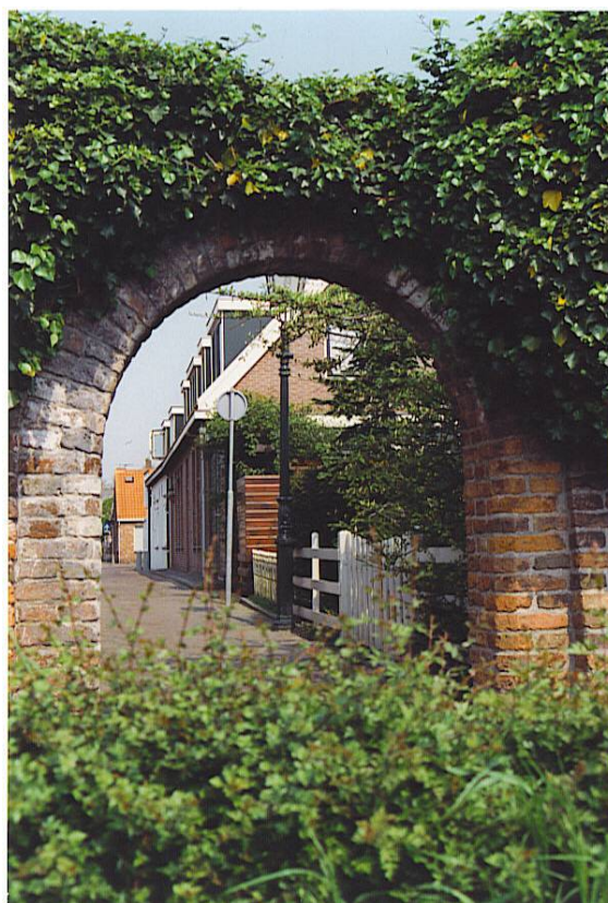
Poortje in de stadsmuur van Montfoort

De werkgroep heeft haar mening over en activiteiten bij verschillende lokale onderwerpen op het gebied van ruimtelijke ordening en cultuurhistorie diverse keren in de media kenbaar kunnen maken. Het betroffen bijdragen over de Kloostertuin, de beoogde locatie van de manege op Willeskop, de okkernootbomen en de boerderij Liefhoven.