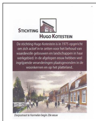
Voorzijde folder werkgroep Harmelen van St. Hugo Kotestein

Evenals in de voorgaande jaren hebben leden van de werkgroep Harmelen een initiërende en uitvoerende rol gespeeld bij de jaarlijkse Open Monumentendag in september en de daaraan gerelateerde klassendag. Dit jaar was het thema "Reizen". Er is een specifieke folder beschikbaar over werkgroep Harmelen van Stichting Hugo Kotestein. Deze folder kan bij evenementen worden meegenomen of na aanvraag worden toegezonden.