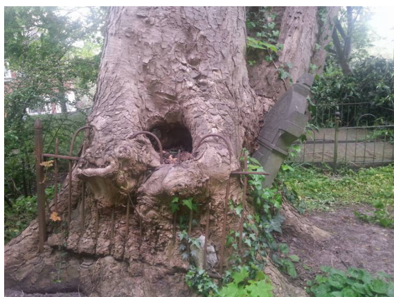
Boom op begraafplaats

De werkgroep Bodegraven-Reeuwijk vindt dat de begraafplaats er rommelig bij ligt. De gemeente is verantwoordelijk voor het onderhoud van de begraafplaats. Er staat evenwel bij de gemeente geen groot onderhoud aan de begraafplaats gepland. Door de gemeente is toegezegd dat er met de voor groenonderhoud verantwoordelijke wethouder overlegd zal worden over de mogelijkheden voor een opknabbeurt. Nagegaan zal worden of de ruimte die er nog is in de subsidiepot voor gemeentelijke monumenten, hiervoor kan worden benut.