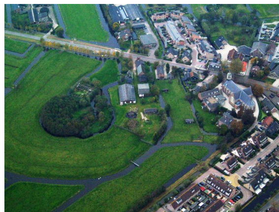
De Kromme Kamp

De gemeente had plannen voor bouwontwikkelingen aldaar. Vooralsnog gaat dit plan niet door.