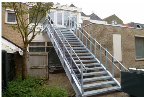
De bewuste trap in de Kloostertuin

In 2013 betrok de Hersteld Hervormde Gemeente (HHG) de bovenverdieping van het Rabobank gebouw en nam ook de tuin in gebruik. Daartoe werd in de tuin zonder vergunning een grote nieuwe trap geplaatst. Hiertegen heeft de werkgroep bezwaar gemaakt.