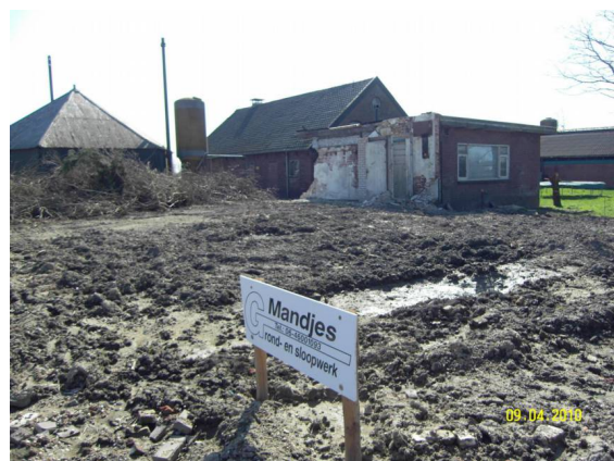
Reijerscop 35: Sloop in 2010.