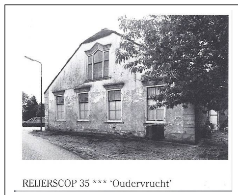
Reijerscop 35: Afbeelding van het voormalige pand. Voor 2010 werd dit monumentale pand verwaarloosd

Ter illustratie het verdwenen monumentaal zeer waardevolle pand Reijerscop 35. Het boek "Monumenten-Inventarisatie Provincie Utrecht / Harmelen" geeft informatie met een afbeelding over Reijerscop 35. Het pand heeft *** , hetgeen betekent dat het een monumentaal zeer waardevol pand is. Het onderhoud van Reijerscop 35 werd helaas totaal verwaarloosd en het pand is in 2010 gesloopt.