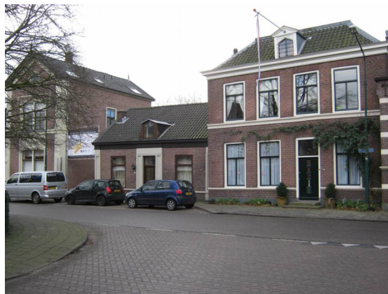
Dorpsstraat 181 (midden): Woonhuis in 2013.

De objecten Dorpsstraat van de oneven huisnummers 129, 135 en 177 t/m 181 zijn het afgelopen jaar gerealiseerd en hebben hun invulling gekregen.