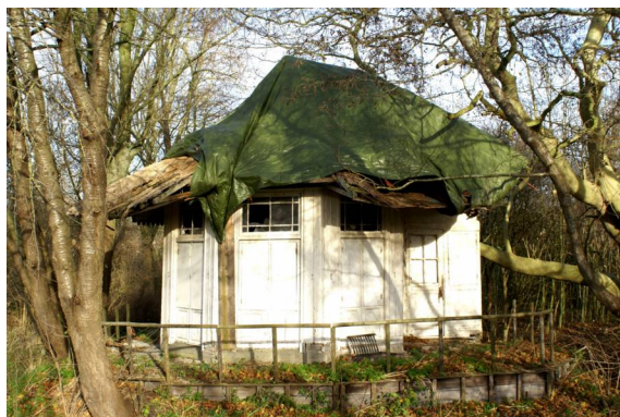
Theekoepel Van Aelst

Nog steeds is er groot achterstallig onderhoud aan een aantal belangrijke rijksmonumenten in de gemeente Oudewater.