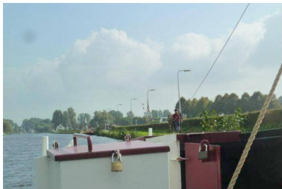
Trekvaart Bodegraven - Woerden

De werkgroep heeft het initiatief genomen om de reis per trekschuit van Bodegraven naar Woerden weer te doen plaatsvinden. Er is met twee schuiten gevaren. Een deel van de tocht zijn de schuiten door een paard getrokken, andere delen door de deelnemers zelf.