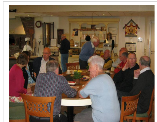
pressie donateursdag: ontvangstruimte van Bakkerij Siegert dat tevens een museum is.