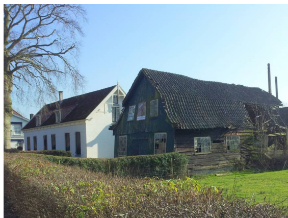
Boerderij Liefhoven met timmermanswerkplaats

Medio 2014 vestigde de gemeente Montfoort een voorkeursrecht op het perceel. De werkgroep zet zich in voor een mooie nieuwe bestemming.