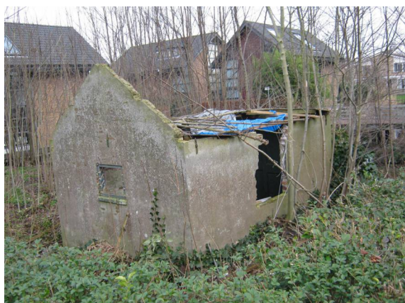
Kerkhof Leidsestraatweg eind 2014. Het graf met de grote grafsteen is het 'monumentale' grafmonument van jhr. Caan van Maurik, overleden in 1888.