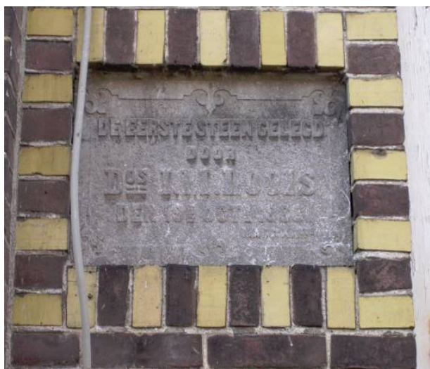
De twee gevelstenen

In 2013 heeft firma Radix en Veerman een nieuw bouwplan gepresenteerd. Het bouwplan is beter dan de twee vorige plannen van de ontwikkelaar. Echter de werkgroep heeft een groot bezwaar en dat is het toekomstig aanzicht van de Jan de Bakkerstraat. De Jan de Bakkerstraat is één van de laatste straten in de Woerdense binnenstad die nog een authentiek karakter heeft. Door het nieuwe bouwplan gaat dat karakter totaal verloren. Het profiel van de straat wordt aanzienlijk breder. Er komen veel parkeervakken. In het ontwerp wordt geprobeerd de huidige rooilijn te handhaven. In de praktijk zal de straat door de open structuur van de bebouwing niet beleefd worden als een oude stadsstraat.