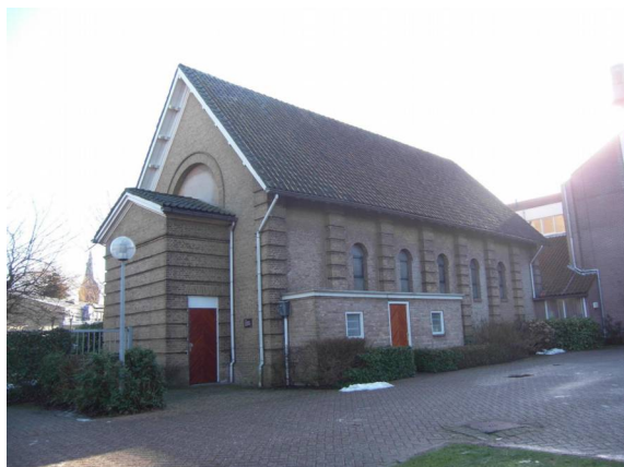
Dorpsstraat 70 - Gaza Kapel zonder klokkentoren.

In het AD Woerden is hierover verslag uitgebracht.