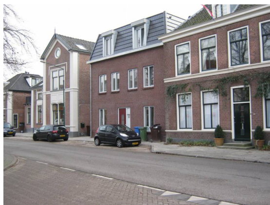
Dorpsstraat 181 (midden): In 2014 omgebouwd naar zes appartementen. Links het voormalige doktershuis (nr. 179) dat ook is verbouwd.

De werkgroep heeft de ontwikkelingen nauwlettend gevolgd of er sprake was van afwijking in het bouwproces ten opzichte van de verleende vergunningen.