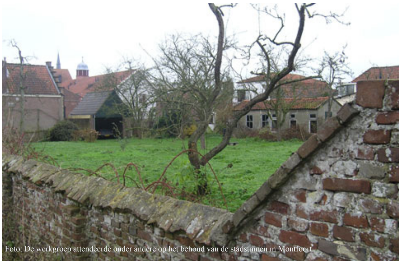
Foto: De werkgroep attendeerde onder andere op het behoud van de stadstuinen in Montfoort.