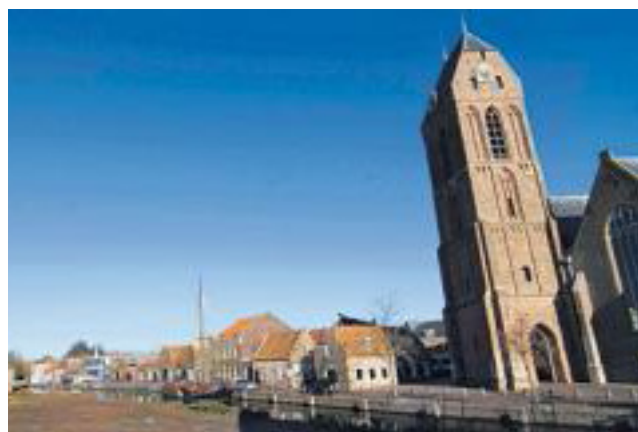
De Westerwal grenst aan het historische centrum van Oudewater.

De contacten met gemeentebestuur en ambtenaar voor monumenten zijn afgelopen jaar verstevigd. De werkgroep stelt zich positief kritisch op. Zij heeft voorgesteld dat Oudewater meer met andere gemeenten samenwerkt bijvoorbeeld op het gebied van archeologie. Beschermd stadsgezicht verdient ook meer aandacht, evenals het instellen van een bredere monumentencommissie, die meer kwaliteit kan garanderen.