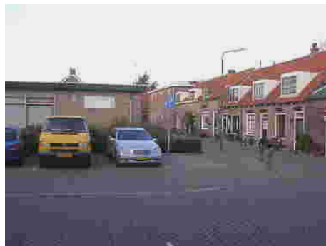
Tegenover deze oude huisjes aan de Schoolstraat in Montfoort beoogt de gemeente een fors appartementencomplex . Historisch verantwoord?

In de media zijn in 2004 13 artikelen verschenen waarin de SHK- werkgroep zich opinievormend heeft gemanifesteerd. Daaronder is een drietal langere, geheel aan de mening van SHK gewijde artikelen: "De armoede van de welvaart", "Kansen en bedreigingen voor historisch Montfoort" en "Bezorgdheid monumentale panden centrum Montfoort". Bij de meeste onderwerpen die de historie aangaan wordt de werkgroep om haar mening gevraagd door de media