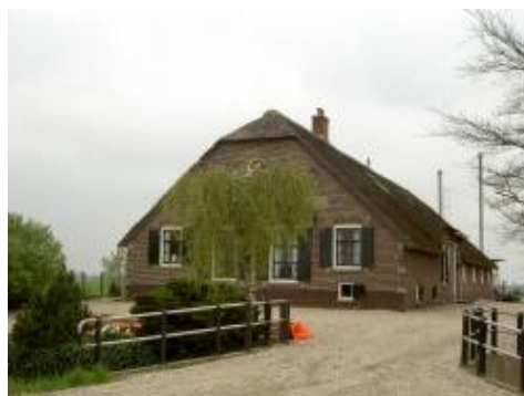
Langhuisboerderij Gerverscop 9