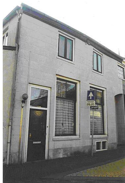
Hoogstraat 55-57, Montfoort