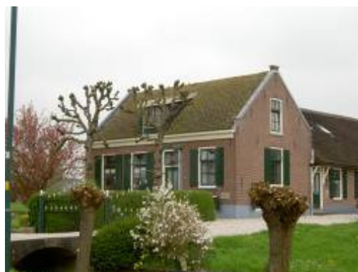
Dwarshuisboerderij Gerverscop 13/13a

Op zaterdag 11 september 2004 heeft de werkgroep d.m.v. een tentoonstelling in het gebouw H2O aandacht besteed aan de Oude- en Nieuwe Hollandsewaterlinie. Ook de inundaties vanuit de 2 e wereldoorlog werden belicht.