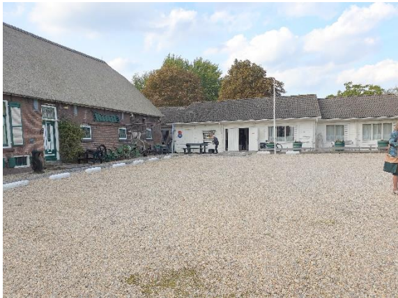
de witte aanbouw wordt vervangen door nieuwbouw

Inmiddels zijn er vergevorderde plannen voor vervangende nieuwbouw van de huidige aanbouw bij de boerderij.