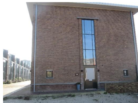
Op deze gevel komt het siersmeedwerk uit 1948 terug

Stichting Hugo Kotestein heeft in 2011 een boekwerkje uitgebracht, waarin zes objecten die bij jubilea van het militaire Centraal Magazijn tussen 1873 en 1973 zijn onthuld, zijn beschreven.