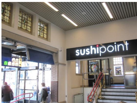
Oude ramen naast hedendaagse lichtreclame

De ruimte bij de "Kiosk" zal worden verbouwd tot een 'huiskamer', hier kunnen reizigers wachten op vertrek van trein of bus.