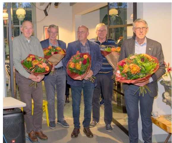
Bestuur Stichting Hofstede Batestein

In het ontwerp is een zichtcorridor opgenomen vanaf de Van Kempensingel naar de gerestaureerde boerderij. Nu de zichtcorridor is gerealiseerd komt het monumentale boerderijcomplex, met de bomenrijen van het landgoed als decor, heel goed tot zijn recht.