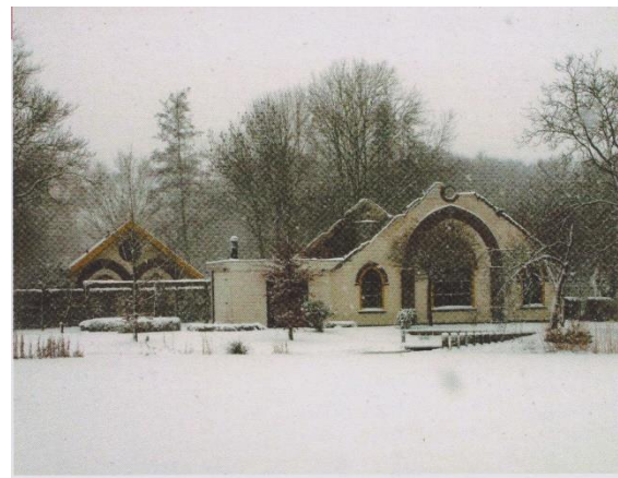
Na de brand in 2008

Op 8 november werd de Hugo Kotestein-oorkonde uitgereikt aan het bestuur van Stichting Hofstede Batestein als waardering voor de inspanningen om de Hofstede zoveel mogelijk in de oorspronkelijke staat te herstellen en een nieuwe functie te geven. Een verslag over de uitreiking staat elders in dit jaarverslag.