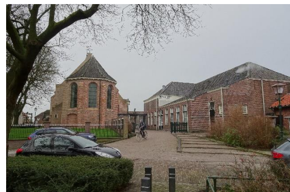
Hervormde kerk en De Wingerd

In 2019 kwam de Hervormde kerk Linschoten met een ingrijpend totaalplan naar buiten. Het betreft een interne verbouwing en uitbreiding van de Wingerd alsmede de bouw van een foyer tussen de Wingerd en de kerk, de verkoop van de pastorie en de bouw van een nieuwe pastorie en uitbreiding van de begraafplaats op het Weitje van Spruit. De gemeenteraad ging in principe akkoord maar gaf wel aan dat voor alle onderdelen de formele processtappen doorlopen moesten worden en dat elk onderdeel openstond voor zienswijzen en bezwaren.