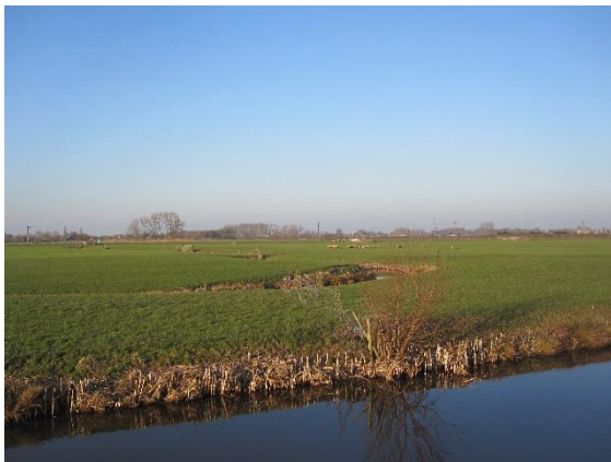
Polder Barwoutswaarder is zoeklocatie voor het opwekken van energie uit wind en zon

De gemeente Woerden heeft een Afwegingskader opgesteld om te kunnen bepalen waar ruimtelijk gezien in Woerden windmolens en zonnevelden kunnen komen. In juli 2021 is het Afwegingskader behandeld in de gemeenteraad. De uitkomst is dat voor het grootschalig opwekken van windenergie er twee gebieden in beeld zijn: de polder Reijerscop en een strook bij de A12 in Barwoutswaarder.