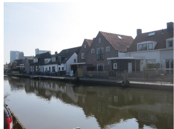
Deze huizen en het jaagpad moeten wijken voor de nieuwe Rembrandtbrug

De schaduwkant van ons standpunt is dat voor de oprit naar de brug een deel van het bebouwingslint van de buurtschap Barwoutswaarder moet wijken en dat het jaagpad langs de Oude Rijn zal worden onderbroken. Uit studies blijkt dat een ongelijkvloerse kruising van het jaagpad financieel niet haalbaar is.