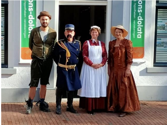
Gezelschap van Swiebertje

herhalen. Dit jaar was de speciale aandacht voor het historische gemeentehuis dat in 1868 in gebruik werd genomen. In dit gemeentehuis werkte en woonde de burgemeester en waren de politiepost (veldwachter) alsmede de brandweer er gehuisvest. Met medewerking van de plaatselijke toneelvereniging Harto, de vrijwillige brandweer en de sectie historisch materieel van de Woerdense brandweer kon er flink worden uitgekapt om de historie te doen herleven.