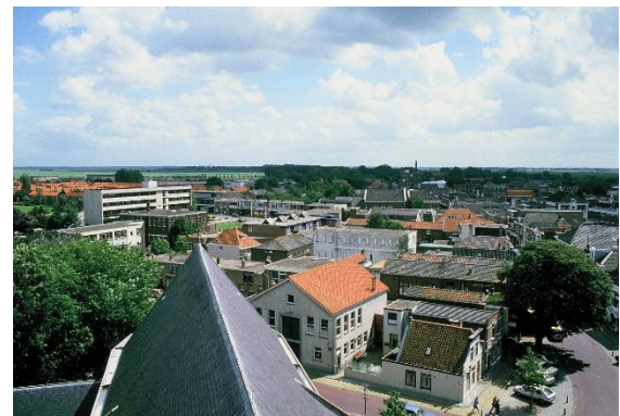
Locatie aan de kop van de Kerkstraat waar 'Pastoriestaete' moet verrijzen. Historische opname 1985.

Enkele van die onderwerpen zijn: het project 'Pastoriestaete' van vastgoedontwikkelaar Rhynele voor de hoek van de Kerkstraat, het Pastorieplein en het Voorplein – één van de meest historische en 'gevoelige' plekken van Bodegraven door de dominante aanwezigheid van de grotendeels middeleeuwse Dorpskerk (voorheen Sint Galluskerk) en door de karakteristieke bebouwing rond de Oude Markt.