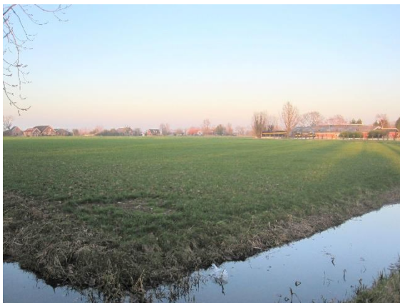
Boerderijlint in polder Rietveld

Daarnaast kan het rapport ook gebruikt worden bij het opstellen van Omgevingsplannen als er ruimte gezocht wordt voor een toekomstige uitbreidingswijk, bedrijfsterrein of recreatiegebied.