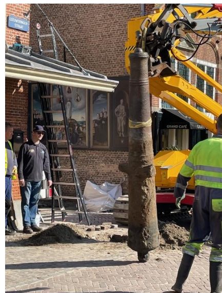
verwijdering van kanonnen

Sinds mensenheugenis hadden voor de Heksenwaag twee oude verspijkerde kanonslopen gestaan: loodrecht onder de luifel, ter bescherming tegen bestel- en vrachtwagens en ook in een symbolische rol. In zijn ondoorgrondelijke wijsheid besloot het gemeentebestuur de beide kanonnen uit te graven en te vervangen door kleine hardstenen paaltjes.