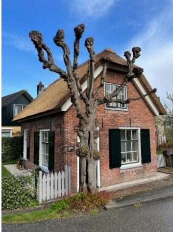
Tolgaardershuisje met leiboom

De werkgroep werd verrast door een verleende kapvergunning van een 90 jaar oude leilinde voor het tolgaarders huisje van Linschoten aan de Nieuwe Zandweg.