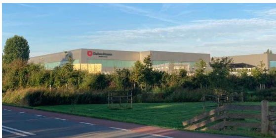
containeropslag op Willeskop 94

De werkgroep is vanaf 2011 betrokken bij de ontwikkeling van het terrein van de voormalige steenfabriek IJsseloord. Dit heeft uiteindelijk geleid tot een voor ieder acceptabel plan: Nieuwe Toekomst IJsseloord met behoud en restauratie van cultureel erfgoed, de aanleg van natuur en ruimte voor ca. 1 ha vrachtwagenparkeerterrein voor het toenmalige bedrijf Jan Snel. Intussen is Jan Snel overgenomen door Daiwa House en zijn de vrachtwagens verdwenen. Deze hebben plaats gemaakt voor de opslag van containers. En deze staken al snel ver boven de grondwal uit. Een verzoek tot handhaving werd erg traag behandeld en de ondernemer kwam met de aanvraag voor een tijdelijke vergunning van drie jaar voor de opslag van containers tot 7 meter hoog voor een deel van het terrein. Dit tast de ruimtelijke kwaliteit van de omgeving flink aan.