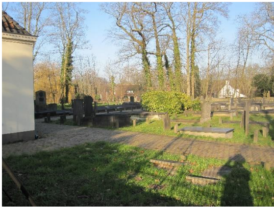
Grafzerken op de oude Algemene begraafplaats worden gerestaureerd

In het poortgebouw wordt informatie getoond over de historie van de twee bastions en het gebruik van de twee aanwezige begraafplaatsen. De gegevens van de ca. 6000 begravingen, die op de oude Algemene begraafplaats hebben plaatsgevonden, zijn hier in te zien.