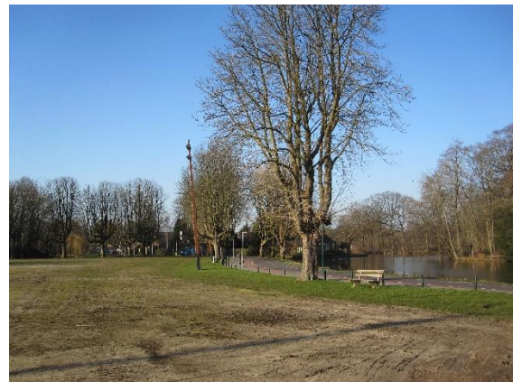
Deze bomen bij het Exercitieveld blijven staan zolang dat verantwoord is

In juni 2021 is aan de gemeenteraad een nieuw voorstel voorgelegd met een aantal scenario's. Een meerderheid van de Raad was ervoor dat zoveel mogelijk kastanjabomen blijven staan totdat ze aan het einde van hun natuurlijke bestaan zijn. Dit is nu het beleid.