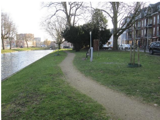
Het pad langs de binnengracht bij het Plantsoen

Op 8 april werd door wethouder T. de Weger een naambordje onthuld bij het halfverharde pad langs de binnengracht bij het Plantsoen. Het pad heet nu "Hugo Kotesteinpad". In het kader van de herdenking "350 jaar Oude Hollandse Waterlinie" heeft B&W van Woerden het initiatief genomen de naam van de Woerdense stadstimmerman en bouwmeester Hugo Kotestein te verbinden aan dit pad.