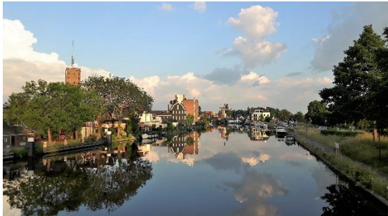
Panorama Bodegraven vanaf de Crolesbrug

De toekomst van beeldbepalende boerderijen kwam eveneens aan de orde; zie elders ook het verslag van het seminar over 'boerderijlinten' in het Huis te Linschoten begin juni.