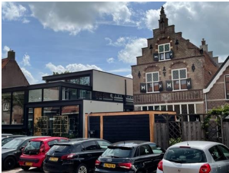
Schuur voor de deur

Vanaf de Lange Burchwal was jarenlang de trapgevel te zien van een oud woonhuis, niet in de rij maar een stuk naar achter gelegen. Aan de straatzijde heeft het een grote gevelsteen, voorstellende een touwslagerij.