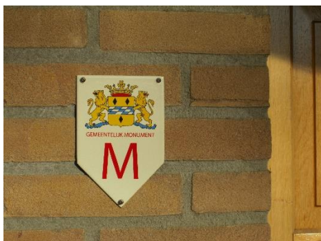
De kapel is nu een gemeentelijk monument

Careyn deelde destijds mee dat de kapel behouden kon worden, maar dan zou het benodigde geld door acties van particulieren bijeen gebracht moeten worden. Een groep Woerdenaren wilde de kapel behouden en richtte direct een stichting op. Stichting Hugo Kotestein ondersteunde de nieuwe stichting en bracht in april 2014 een rapport uit waarin de monumentale waarden van het gebouw en de betekenis van de kapel voor Woerden werden beschreven.