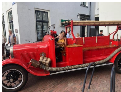
de oude brandweerauto

Op vrijdag 9 september was het traditioneel de klassendag voor de groepen 7 en 8 van het basisonderwijs. Wederom werd deze dag volgens het beproefde en nog steeds succesvolle concept georganiseerd. De groepen 7 krijgen een rondleiding langs de monumenten in het centrum van het dorp met een bezoek aan de NH Kerk met in de consistoriekamer van deze kerk een tentoonstelling van de Stichts-Hollandse Historische Vereniging met als thema "Historisch Harmelen".