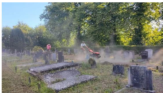
het omwoelen van de paden

Na veel overleg en productie van beleidsstukken door de gemeente en diverse groeperingen uit de samenleving werd de onvrede over de deplorabele staat van de begraafplaats alsmat groter. Voor nabestaanden met een fysieke beperking was het niet veilig om hun dierbaren te bezoeken op een door onkruid overwoekerde begraafplaats.