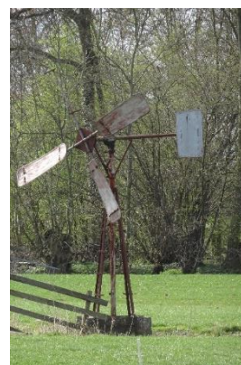
De unieke weidemolen bij landgoed Cromwijk

Na het opheffen van de gemeentelijk monumentencommissie de aanwijzing gemeentelijk monumenten stilgevallen. De werkgroep heeft medio 2021 aan de gemeente vier objecten voorgedragen voor aanwijzing. Het gaat om het drinkwaterzuiveringsstation aan de Julianalaan 14, de weidemolen bij landgoed Cromwijk en een tweetal stadstuinen in Montfoort. Einde 2021 heeft er nog geen concrete aanwijzing plaatsgevonden.