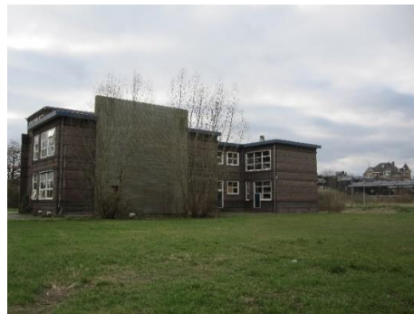
Blinde gevels van de oude Minkemaschool

Het monumentale stationsgebouw mag niet door brede en hoge bouwmassa's worden weggedrukt. In de nabijheid staan al hoge gebouwen op het voormalige Monaterrein en het Defensie-eiland. En in Middelland-Noord worden binnen enkele jaren meerdere woongebouwen gerealiseerd van 8 of 11 bouwlagen.