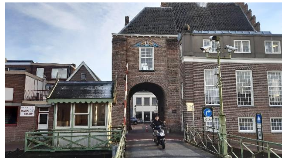
Een uniek ensemble.

Rijkswaterstaat (RWS) heeft aangegeven in het najaar van 2022 de brug te willen renoveren en ook van het brugwachtershuisje af te willen. Er is een initiatiefgroep ontstaan bestaande uit Stichting Hugo Kotestein en een particulier, die het brugwachtershuisje op de huidige plek wil behouden en het huisje wil opknappen. De gemeente is inmiddels ook overtuigd van het belang het ensemble te behouden. In 2021 is er tussen RWS, de gemeente en de stichting overeenstemming bereikt.