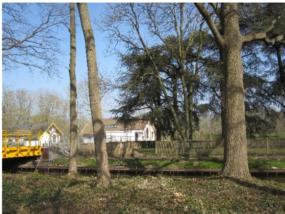
Hier komt de nieuwe toegangsweg naar de Hofstede Batestein

Een tweede positieve ontwikkeling is dat het bestemmingsplan voor het Entreegebied Landgoed Bredius in 2021 rond kwam. Dit bestemmingsplan maakt het mogelijk dat er een entree komt vanaf de Burg. H.G. van Kempensingel naar het Landgoed en Hofstede Batestein.