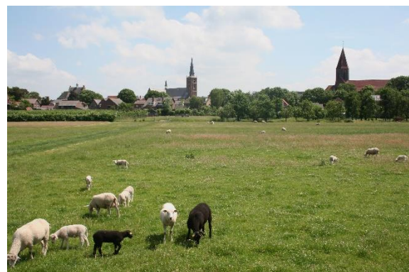
Hoe lang blijft dit nog het zicht op Montfoort vanuit het noorden

Het brugwachtershuisje kan op de huidige plek blijven en de RWS draagt het eigendom van het huisje over. De initiatiefgroep is permanent in overleg met RWS en de gemeente om het beeldbepalende brugwachtershuisje te redden. De stichting is inmiddels toegetreden tot de ontwerpcommissies van RWS en de aannemer. Er zal nog wel wat water door de IJssel stromen voordat alles is geregeld, maar Stichting Hugo Kotestein zal zich er tot het uiterste voor inzetten om het historisch beeld op de noordkant van de stad te behouden.