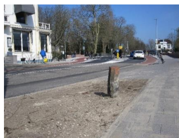
Historische hectometerpaal op de Oostdam

De opvallende muur die met een borstwering hoog boven het water uitsteekt, oogt erg nieuw. Het is te hopen dat het metselwerk snel verweert en een eenheid gaat vormen met het metselwerk van de lagere kademuur bij de Snellerbrug.