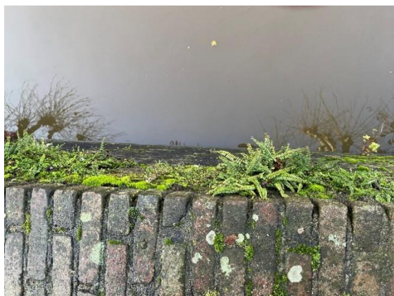
blaasjesvaren, waterbalsemien, wolfsfoot, echte muurvaren (plukje midden onder)

Uit hetzelfde advies kwam het voorstel de gracht langs de Donkere Gaard en de Kromme Haven te beplanten met decoratieve, hoog opgaande waterplanten. Dit advies gaat volledig voorbij aan de aanwezigheid van de natuurlijke muurvegetatie tegen de kademuren, bestaande uit een vegetatiekundig verbond van karakteristieke, beschermde soorten muurvarens, muurleeuwenbekken, havikskruid, wolfsklauw, geel helmkruid en glaskruid.