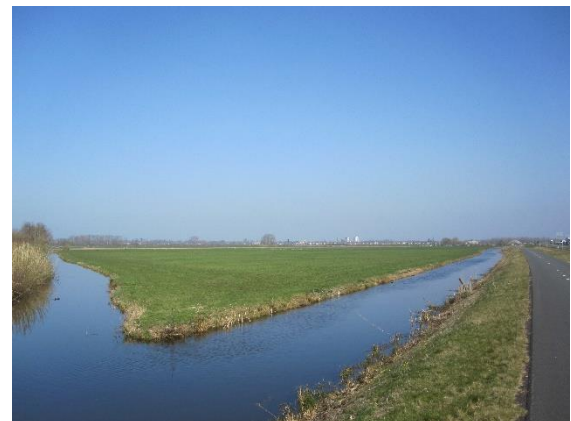
Zoeklocatie in polder Barwoutswaarder bij de A12 voor het opwekken van windenergie

De gemeente Woerden heeft een Afwegingskader opgesteld om te kunnen bepalen waar ruimtelijk gezien in Woerden windmolens en zonnevelden kunnen komen.