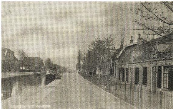
Rechtsvoor pand Samsom in 1939.

De stichting is tegen deze vergunning een bezwaarprocedure gestart bij de gemeente. Speciaal richtten onze bezwaren zich tegen het handhaven van de parkeerplekken in de nieuwe voortuin van de appartementen. Na overleg met de gemachtigde van de eigenaar is ons schriftelijk toegezegd de parkeerplekken te laten vervallen en weer een nieuw tuinhek te plaatsen. Hierop heeft de stichting haar bezwaarschrift ingetrokken.