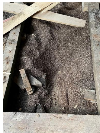
Vlasdoppen als isolatiemateriaal onder een 17 e eeuwse vloer.

Het dubbele pand met huisnummer 8 (voorheen antiekwinkel) wordt met zorg gerestaureerd. In dit pand werd tussen een vloer op de begane grond en een keldergewelf een dikke isolatielaag bestaande uit vlasdoppen aangetroffen. Het isolatiemateriaal was vermoedelijk 300 jaar oud, droog en geurloos.