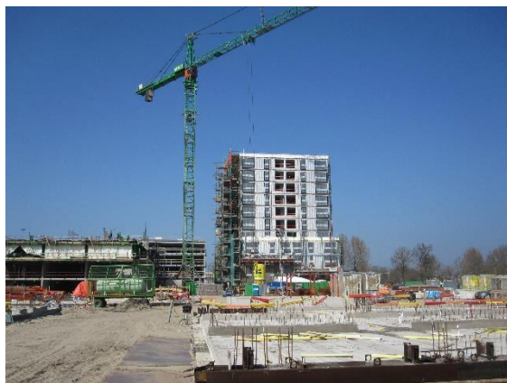
Hoogbouw in Middelland-Noord dichtbij het NS-station

Na een overlegtraject met inwoners en ondernemers in 2020 is er een stedenbouwkundige visie opgesteld voor het stationsgebied. In mei/juni 2021 is de visie behandeld in de gemeenteraad en aangenomen.