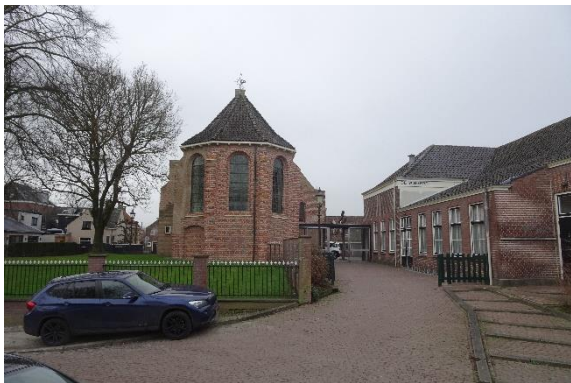
De Wingerd en de Hervormde kerk Linschoten

Twee zaken vindt de werkgroep echter een grote aantasting van het pittoreske dorpshart. De voorgestelde bouw van de foyer, die de solitaire middeleeuwse kerk en de Wingerd laten verkleven en het bebouwen van het Weitje van Spruit. In 2020 komt de werkgroep met een alternatief plan: het optimaliseren van het ruimtegebruik binnen de bestaande Wingerd door het toevoegen van tussenvloeren in combinatie met het deels verlagen van de begane grond vloer. Ook uitbreiding van het gebouw aan de noordzijde ziet de werkgroep als een mogelijkheid. De kerk wijst deze opties vrijwel alle af; hen staat duidelijk een andere oplossing voor ogen. Ook de optie van het verbouwen van het bestaande huis van Spruit aan de Nieuwe Zandweg (eigendom van de kerk) tot nieuwe pastorie wijst de kerk af. Hen staat duidelijk de oplossing van nieuwbouw op het Weitje van Spruit voor ogen. Daarmee verdwijnt een zeer gewaardeerde stuk groen in het hart van het dorp.