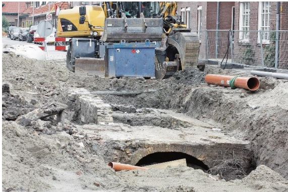
Lange Burchwal geeft restanten van een oud bouwwerk prijs.

geschiedkundige vereniging in dank aanvaard en tentoongesteld werd.