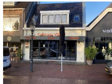
Herbouw cafetaria Vikas