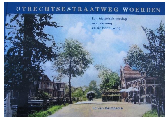
Boek van 306 pagina's over de Utrechtsestraatweg

Aan de Utrechtsestraatweg staan veel beeldbepalende woningen uit de periode 1880-1960. Enkele zeer opvallende panden zijn beschermd via de gemeentelijke monumentenlijst. Voor de andere waardevolle