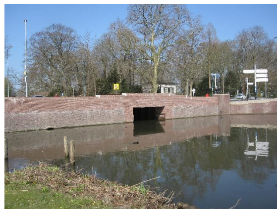
Nieuwe duikerbrug onder de Oostdam

Deze duiker was in 2020 aan vervanging toe. De gemeente heeft besloten om in plaats van de duiker een duikerbrug te maken, waardoor het voor lage boten mogelijk wordt om een rondje om de stad te varen. Begin 2022 is de duikerbrug opgeleverd.