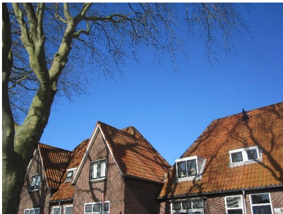
Voor zonnepanelen op beeldbepalende bebouwing zijn richtlijnen nodig

In het verstedelijkte deel van Woerden en in de drie dorpen, die tot de gemeente behoren, staan veel monumentale en beeldbepalende gebouwen.