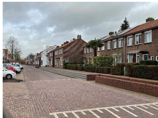
Straat waterpas gelegd, huizen op de oude stadswal liggen hoger.

Dit ging anders bij de Lange Burchwal. Deze werd over de volle lengte waterpas gelegd, waardoor de woningen aan de oostzijde een stoep met een twee- of drievoudige aantrede kregen. Voor rollators en andere wagentjes of