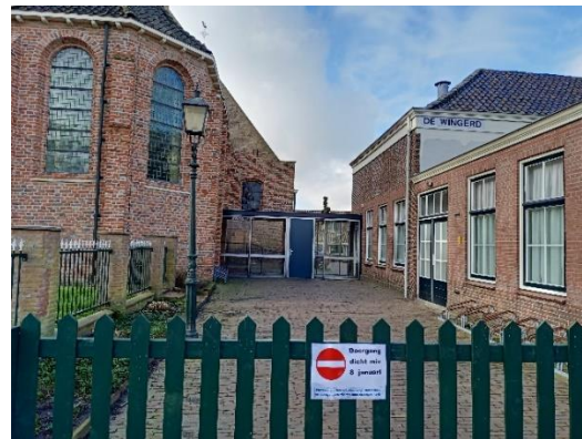
De doorgang tussen de Wingerd en de Hervormde kerk is afgesloten

De werkgroep heeft vervolgens een alternatief plan voorgesteld met een wat minder opdringerige architectuur waarbij de foyer meer als verlengstuk van De Wingerd oogt. Daardoor blijft er meer ruimte rondom de kerk en oogt de kerk meer solitair. De kerk heeft