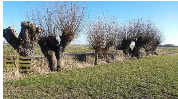
Zeer oude knotwilgen verdienen bescherming

Ondanks enkele verzoeken is de bomenlijst nog steeds niet geactualiseerd. De werkgroep heeft er bij de gemeente op aangedrongen dit begin 2022 in orde te maken.