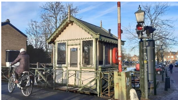
Het brugwachtershuisje is hoognodig aan onderhoud toe

De IJsselbrug en het brugwachtershuisje tegen de achtergrond van Het Oude Stadhuis en de IJsselpoort vormen een fraaie historische entree aan de noordkant van de stad Montfoort. Bij de IJsselbrug en het bijbehorende brugwachtershuisje is sprake van veel achterstallig onderhoud en de brug moet technisch worden aangepast.