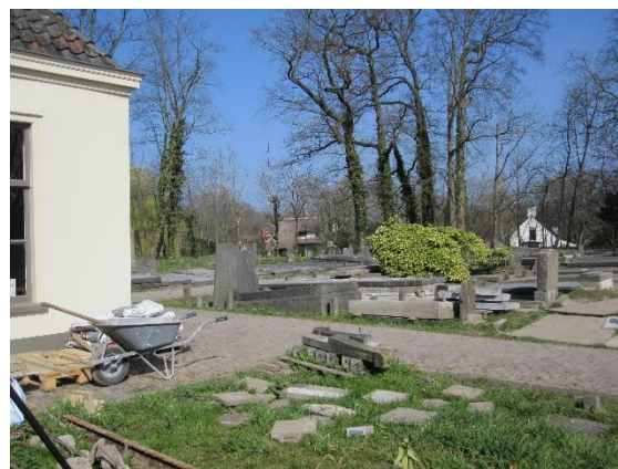
Grafzerken op de oude Algemene begraafplaats worden gerestaureerd

De gemeente wil de historie van de Woerdense vestingwerken zichtbaarder maken. Een al lang bestaand plan om de oude Algemene begraafplaats op het bastion Het Holle Bolwerk te herstellen wordt thans uitgevoerd. Op deze begraafplaats uit 1829 wordt sinds 1978 niet meer begraven. Veel grafzerken zijn gebroken, veel grafkelders zijn ingestort. De gemeente gaat de restauratie van de graven uitvoeren. Bestaande paden worden hersteld. In 2021 is hiervoor een vergunning verleend.