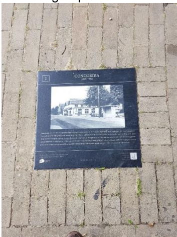
Attentiesteen in Hengelo (Gld).

De werkgroep beraadt zich al geruime tijd over een plan om in de dorpskern enige panelen met een historische foto te plaatsen of stoeptegels met een opdruk van een historische foto. Tot een uitgewerkt voorstel zijn we - mede veroorzaakt door coronaperikelen - nog niet gekomen.