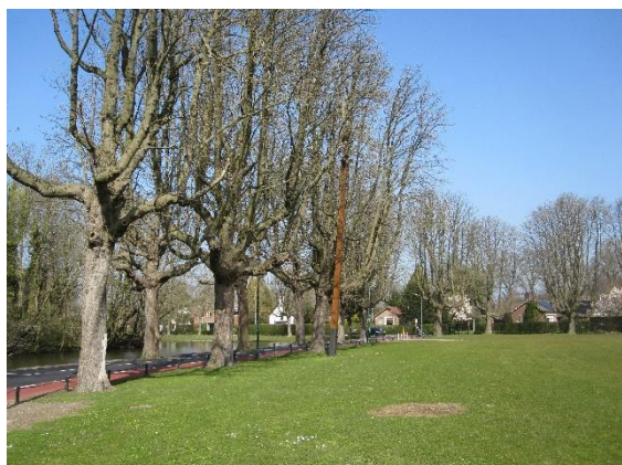
Deze bomen bij het Exercitieveld blijven staan zolang dat verantwoord is

De afgelopen twee jaar is meerdere keren in de gemeenteraad gediscussieerd over de bomen op het Exercitieveld. In 2020 lanceerde de gemeente het plan om alle nog overgebleven bomen rond het Exercitieveld te kappen, waarna een enkele rij bomen zou worden teruggeplant. Redenen hiervoor waren het opknappen van het wegdek op de Oostsingel en de Oostlaan en het vervangen van het riool. Dit plan leidde tot veel kritiek vanuit de bevolking en de Raad. Uiteindelijk werd na veel discussie en het indienen van meerdere moties besloten dat het College een nieuw scenario zou uitwerken, waarbij een deel van de kastanjabomen behouden zou worden.