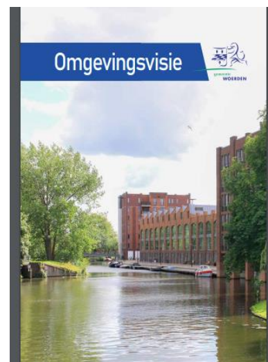
In 2021 verscheen de ontwerp-Omgevingsvisie Woerden

Halverwege 2021 verscheen de ontwerp-Omgevingsvisie Woerden. De werkgroep vond het belangrijk te reageren op dit gemeentelijk beleidsstuk. Omdat we als werkgroep niet fysiek konden vergaderen, hebben we dit online moeten oplossen. In december heeft de werkgroep Woerden, mede namens de werkgroepen Kamerik en Harmelen een zienswijze ingediend.