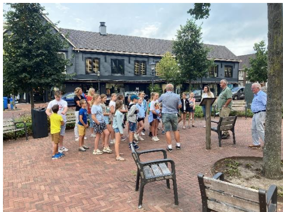
Schoolklas op Open Monumentendag

Op vrijdag 10 september was het traditioneel de klassen dag voor de groepen 7 en 8 van het basisonderwijs. De groepen 7 kregen een rondleiding langs de monumenten in het centrum van het dorp met een bezoek aan de NH Kerk die wordt beschouwd als het mooiste