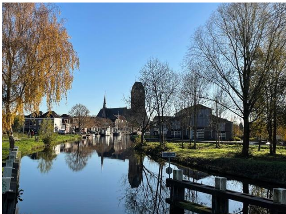
De hallen van de machinefabriek De Hollandsche IJssel: industrieel erfgoed.

De stad Oudewater, met een ontstaansgeschiedenis die teruggaat tot de middeleeuwen: de overblijfselen van de eerste versie van de kerk, als symbool voor het bestaan van een gemeenschap, dateren uit de 11e eeuw. Sedertdien heeft de stad nog steeds een duidelijk stadsplan waarin heftige gebeurtenissen zoals de belegering tijdens de 80-jarige oorlog hun sporen hebben nagelaten. In het huidige grondplan van de binnenstad is de vesting die in de 17e en 18e eeuw herbouwd werd nog duidelijk te herkennen. Zichtbare hoogteverschillen tussen stad en de omgevende weidegronden laten duidelijk zien hoe de stad laag op laag gegroeid is op haar oude fundamenteën, terwijl het omringende veenlandschap gedurende dezelfde duizend jaren aanzienlijk ingeklonken is. Deze vaststelling speelt een belangrijke rol in het bouwhistorisch onderzoek en het stedenbouwkundig ontwerp voor het oude industriegebied Westerwal.