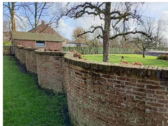
De slangenmuur moet nodig worden gerestaureerd

De eeuwenoude looproute via het Kerkplein verdwijnt hiermee. Behalve kerkgangers heeft er op het Kerkplein niemand meer wat te zoeken. Een verlies aan historische waarde. De omgevingsvergunning voor de bouw van een pastorie op het Weitje van Spruit is door de kerk ingediend. De werkgroep heeft een zienswijze ingediend, maar deze is door de gemeente niet gehonoreerd. De bouw is ondanks ons protest niet tegen te houden, waarmee spijtig genoeg een bijzonder stukje groen in het hart van het dorp verdwijnt en ook hier een verlies aan historische waarde.