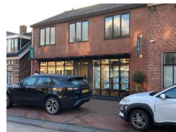
Pand van de voormalige fotograaf Knikman

de oorspronkelijke uitstraling zodat de vertrouwde aanblik ter plaatse in stand kon blijven