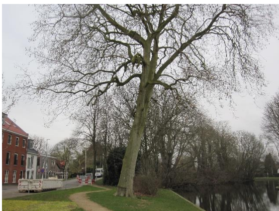
Tracé van de voorgestelde wandelroute over de oude binnenwal

Stichting Hugo Kotestein en de Stichts-Hollandse Historische Vereniging hebben in samenwerking met zes andere erfgoedpartners in mei 2021 een voorstel ingediend voor een wandelroute over de oude binnenwal en de Algemene begraafplaats.