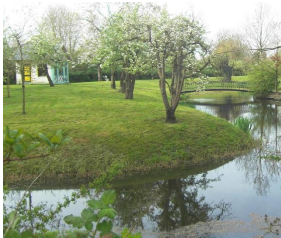
Tuinhuis 't Spijck bij Huize Harmelen

Het rijksmonument het historische tuinhuis 't Spijck is wellicht een van de mooiste, zo niet de mooiste in zijn soort in Nederland. Het verkeert na een 2 e restauratie in prima staat en de plaats bij Huize Harmelen is een mooie omgeving.