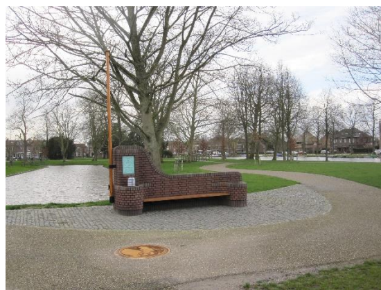
Juliana en Bernhardbank uit 1937

Het padenpatroon is door de ontwerpers Springer en later Van Drie, oorspronkelijk bedoeld voor verharding met grind, ze zijn nu geasfalteerd. Het park heeft door de openheid en de vele nieuwe elementen veel van zijn karakter verloren