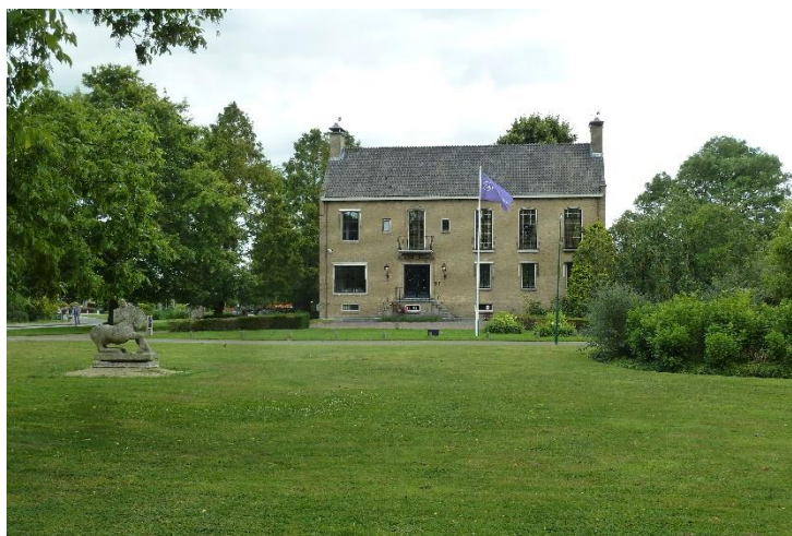
Het voormalige gemeentehuis