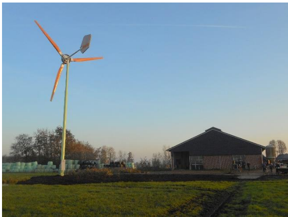
Windmolentje bij een boerderij

Een vergunning binnen het beschermd stadsgezicht kan - anno 2019 - alleen gegeven worden als de beoogde zonnepanelen vanaf de openbare weg niet zichtbaar zijn: op een (plat) dak aan de achterzijde. De gemeente en Hugo Kotestein hebben moeten vaststellen dat er hier en daar binnen het beschermd stadsgezicht toch zonnepanelen zichtbaar zijn en dat deze in voorkomend geval zonder vergunning geplaatst zijn.