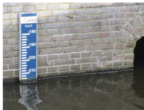
Waterpeil in de polder Zegveld

Om het gebouwde cultureel erfgoed en het cultuurlandschap in het Utrechts-Hollandse weidegebied te behouden vindt Stichting Hugo Kotestein dat het normpeil in zomer en winter niet verder omlaag moet.