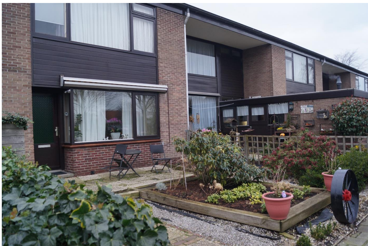
Vóór en achter in de Rietveldwijk