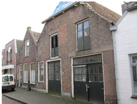
Voorzijde pand Leidschestraatweg 19-21

De panden op Leidsestraatweg 19-21 zijn in 1991 op de gemeentelijke monumentenlijst geplaatst. Het gaat om een woonhuis met ernaast een werkplaats, daterend uit de 18de eeuw. Het is het laatste (nog gave) voorbeeld van bebouwing uit de 18de eeuw in dit deel van Woerden.