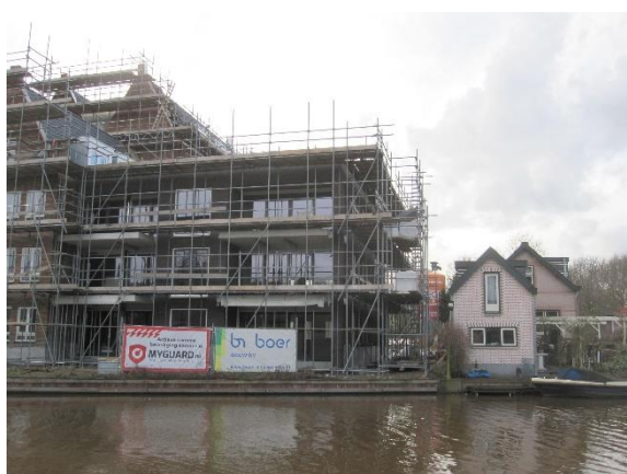
Bij de nieuwbouw is het hoogste punt bereikt

Op 21 maart 2019 was de zitting bij de Raad van State voor de bodemprocedure. Het ging in de zitting om de verdichting in de historische lintbebouwing, parkeeroverlast, vermindering van uitzicht resp. daglicht en toename van windhinder voor de omwonenden.