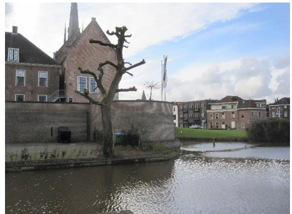
Vestinggracht bij Kasteel

De Stichts-Hollandse Historische Vereniging heeft in een brief aan de Vestingraad gepleit voor meer aandacht voor cultuurhistorie in de nieuwe plannen voor de Binnenstad.