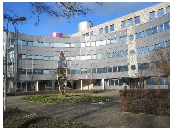
Daan Theeuwescentrum in Middelland-Noord

Verder vraagt de werkgroep in de zienswijze voorzichtig te zijn met hoogbouw. Wij zijn niet tegen hoogbouw, maar vinden het riskant als in alle sectorgebieden van Middelland meerdere hoogteaccenten worden toegestaan, want dat leidt uiteindelijk tot een muur van hoogbouw rond de historische binnenstad.