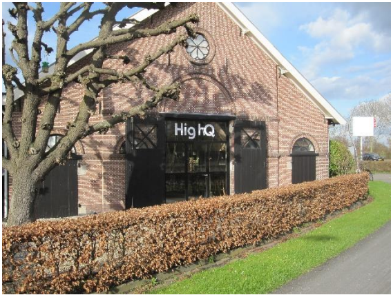
Verstorende reclame op monumentaal pand

De laatste tijd ziet onze werkgroep reclame-uitingen op monumenten en beeldbepalende panden die verstorend werken en afbreuk doen aan het object. In een overleg met de gemeente is het onderwerp besproken.