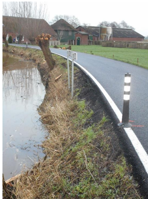
Te herstellen oever met gerooide wilgen

Een met regelmaat weerkerend probleem is de schade aan de beide kades langs de Lange Linschoten: de smalle kadewegen zijn ontstaan in de middeleeuwen (en tegenwoordig geasfalteerd) maar qua draagvermogen en breedte eigenlijk ongeschikt voor vracht- en landbouwverkeer (toegestane breedte 3.00 meter, in tegenstelling tot autoverkeer 2 m 50). Toen in 2017 op diverse plekken waar oevers uitspoelden en de dikke asfaltlaag erboven afbrokkelde, is het bestuurlijk instrument van de gemeentelijke noodverordening gebruikt om de dijklichamen te kunnen herstellen (en het wegdek er bovenop). Om de werkzaamheden te kunnen uitvoeren (beschoeiingen, aanbrengen klei) moesten er omstreeks 450 knotwilgen worden gerooid. Bij verordening van de provincie Utrecht waren de knotwilgen langs de Lange Linschoten eerder aangemerkt als beschermd landschapselement met herplantingsplicht. Aan die laatste verplichting is de gemeente Oudewater nog niet tegemoet gekomen. Eind 2019 heeft Stichting Hugo Kotestein dit andermaal bij de provincie aangekaart en schriftelijk bevestiging gekregen van de herplantingsplicht.