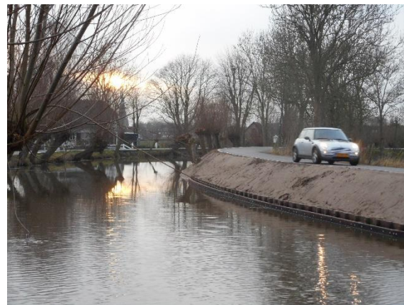
Herstelde oever zonder wilgen

Cultuurtechnisch lijkt het herplanten van knotwilgen een niet te kostbaar en moeilijk karwei: een gratis wilgentak geeft binnen een jaar de gewenste nieuwe boom, die vervolgens om de paar jaar enig onderhoud behoeft in de vorm van het knotten (vroeger vrijwilligerswerk van de Lions' club).