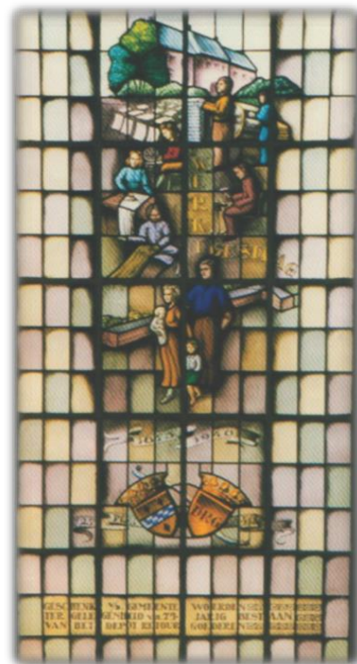
Het raam zoals dat te zien zou moeten zijn

Het glas-in-loodraam is nu geplaatst aan de zuidkant van de Wasserij in het trappenhuis dat leidt naar de appartementen op de verdieping. De voorstelling kan door het publiek niet gezien worden vanaf de binnenkant, en dat is nu juist de bedoeling bij een glas-in-loodraam, dat komt pas tot z'n recht door invallend licht van buiten. Bovendien staat het raam te laag en is het in spiegelbeeld geplaatst, ook dit hoort niet. Allemaal gemiste kansen dus. Het tegeltableau uit 1948, met o.a. een afbeelding van het Kasteel en enige gebouwen van het voormalige militair Centraal Magazijn op het eiland, is in 2019 geplaatst in de openbare