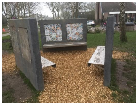
Kunstwerk 'de kalender' (Sanne Dam en Harmelense kinderen)

Helaas waren er ook mensen die zo enthousiast zijn dat ze beelden afzaagden en meenamen. Dit overkwam de beelden bij de Fontein ('spelende kinderen') en de Horizon ('de haan'). Een trieste zaak natuurlijk!! Gelukkig kwam er daarna (in januari 2020) een nieuwe kunstwerk bij het scholencomplex aan de Hendriklaan. Kunstenaar Sanne Dam maakte samen met kinderen van de basisscholen het kunstwerk 'de kalender'. U kunt heerlijk zitten terwijl u naar het prachtige werk kijkt.