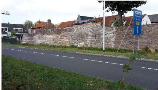
De gebreken aan de stadsmuur worden hersteld