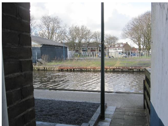
De Oude Rijn bij de kruising Rembrandtlaan en Leidsestraatweg

De te onderzoeken varianten zijn: bij de Rioolwaterzuiveringsinstallatie (2 opties), bij de Gildenweg en bij de kruising Rembrandtlaan-Leidsestraatweg.