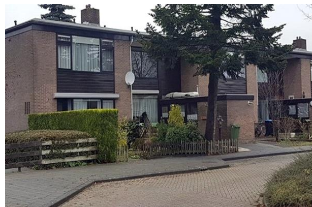
De achter- en vóórtuin om-en-om

Woningbouwvereniging Reeuwijk heeft besloten niet tot nieuwbouw over te gaan, hiertoe "aangespoord" door de Erven Rietveld, de Rijksbouwmeester, de Vereniging Hendrick de Keyser en het Cuypersgenootschap.