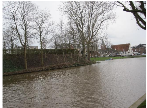
Vestinggracht bij de Torenwal