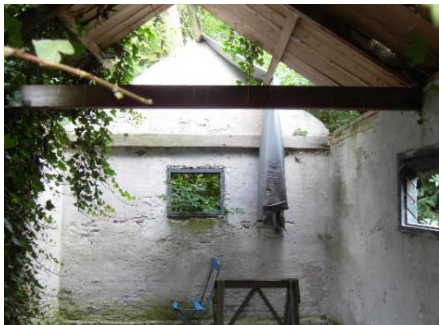
Opbaarhuisje reeds in 2010 (nu in nog veel slechtere staat....)

De gemeentelijke begraafplaats Leidsestraatweg heeft een opknapbeurt nodig; het opbaarhuisje verkeert in deplorabele toestand.