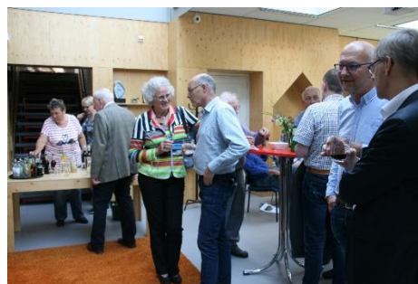
Na afloop was er nog een gezellig en geanimeerd samenzijn in het Dorpshuis van Harmelen.

Voor de genodigden van Stichting Hugo Kotestein en vele belangstellenden uit het dorp Harmelen was dit een fraai schouwspel. Kortom een waardige voltooiing van de renovatie van het Jaagpad.