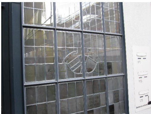
Het glas-lood-raam in de wasserij komt niet tot zijn recht

Medio 2017 hebben wij bij de behandeling van de vergunning voor restauratie van de Wasserij er sterk voor gepleit om het glas-in-loodraam te plaatsen in het horecadeel van de Wasserij. De herinnering aan de vroegere militaire functie van gebouw en terrein zou hierdoor goed zichtbaar zijn geworden. Dat is niet gelukt.