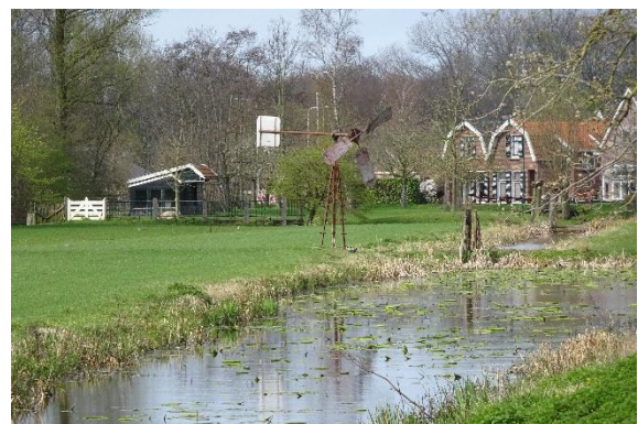
Weidemolen op het land van Cromwijk