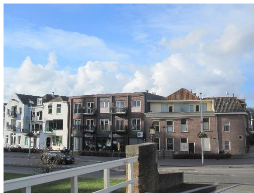
Aandacht voor daken bij omgevingsvergunningen

Dit geeft levendigheid in de stad buiten de openingstijden van de winkels en het is goed voor de sociale samenhang in de binnenstad. Wel bestaat er kans op wildgroei van dakkapellen, loggia's en balkons. De daken in de kern van de binnenstad ogen vaak nog zeer historisch. Het is belangrijk dat dit beeld behouden blijft.