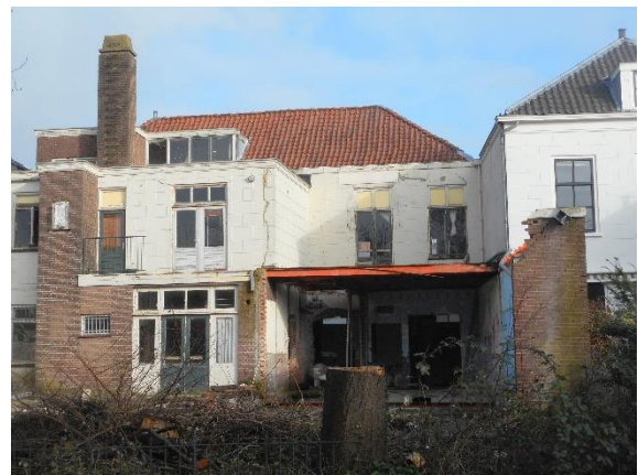
Het postkantoor gezien vanaf de grachtkant

Het voormalig postkantoor van Oudewater, een rijksmonument, staat al jarenlang leeg en de eigenaar heeft er al die jaren geen enkel onderhoud aan laten verrichten.