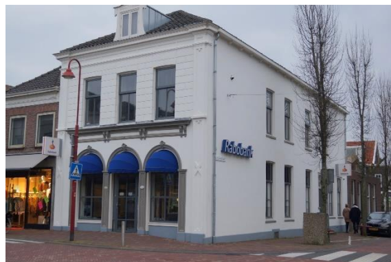
De oude apotheek

In de loop van 2019 werden we ook geconfronteerd met een zeer geslaagde verbouwing en aanpassing van de oude apotheek in het centrum van Bodegraven. Op bijgaande foto de minimale aanpassing om dit karakteristiek pand net dat beetje extra te geven. Een mooi voorbeeld van de samenwerking tussen een bevoegen architect en een welwillende opdrachtgever.