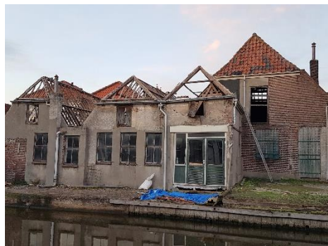
Achterzijde aan de Oude Rijn, zonder dakbedekking

Met dit monument gaat het niet goed. Van het bedrijfsgedeelte staan de drie (evenwijdige) bouwdelen aan de Rijnzijde al enige tijd zonder dakbedekking. Regen en wind hebben vrij spel. Als niet snel wordt ingegrepen door het aanbrengen van een tijdelijke dakbedekking ontstaat grote schade aan de historische bouwkundige constructies. Verder is het dringend nodig dat de eigenaar met een restauratieplan komt om deze beeldbepalende gebouwen voor de toekomst te bewaren.