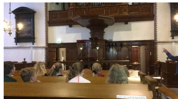
Klassen in de Hervormde Kerk

De kinderen van de groepen 7 startten hun rondleiding bij 'leermonument' de Hervormde Kerk in het dorp. Zij kregen te horen hoe de kerk al in de dertiende eeuw van betekenis was voor Harmelen.