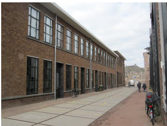
Links gebouw B uit 1947. Hierin zijn nu woningen gemaakt, voorheen was het de kleermakerij en tentenmakerij

In 2020 zijn de bouwactiviteiten op het Defensie-eiland gestaag doorgegaan.