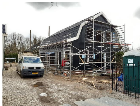
De timmermanswerkplaats van de boerderij Liefhoven wordt herbouwd

Het perceel van de voormalige boerderij van Cromwijk is nu gesplitst in 2 wooneenheden. Het voorste gedeelte, de boerderij met de ingestorte timmerwerkplaats en de hooiberg is verkocht en ook direct bewoond door de nieuwe eigenaar na een ingrijpende restauratie. De werkgroep is blij dat in 2020 de ingestorte timmerwerkplaats is herbouwd.