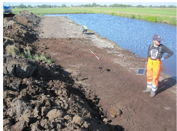
Sporen van houten palen bij de Grecht, die zichtbaar werden door oeverafgraving bij de nieuwe achterwetering