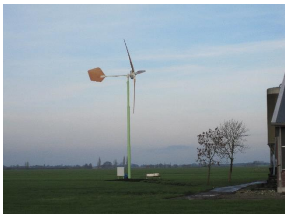
Kleine windmolen bij boerderij Dwarsweg 31 naast de Hazekade

De werkgroep heeft er op aangedrongen dat de gemeentelijke commissie voor Ruimtelijke Kwaliteit en Erfgoed advies geeft over de ruimtelijke inpassing.