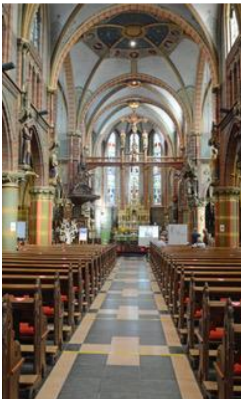
Middenschip van de St. Franciscuskerk

De voorlaatste tranche van de restauratie van de St. Franciscuskerk is op 23 april 2020 opgeleverd.