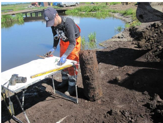
Naast de tafel staat een houten staander die na onderzoek met de 14C-methode is gedateerd op 11 de /12 de eeuw

houten palen die in een structuur leken te staan. Na melding van deze vindplaats zijn enkele paalfragmenten geborgen door bureau Hollandia Archeologen en onderzocht. Dit leverde bij de best bewaarde houten staander een datering in de 11 de /12 de eeuw op, wat in lijn ligt met de aardewerkvondsten uit 2018/2019.