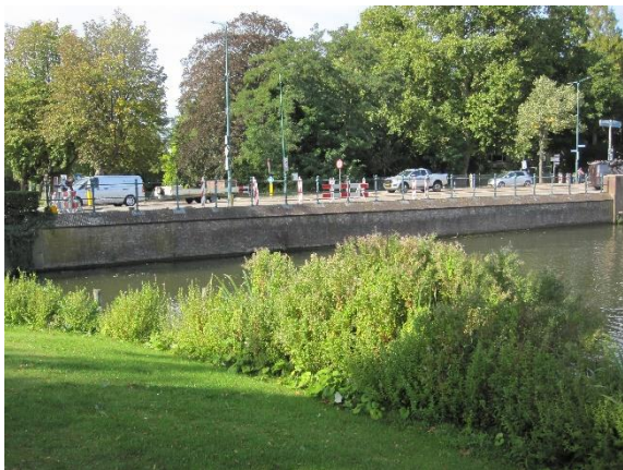
Keermuur op de Oostdam, de voet van de keermuur is van de beer die in 1732 is gemaakt in de buitengracht

In oktober werden de inwoners van Woerden verrast door twee gemeentelijke plannen bij de Oostdam. Ook monumentenstichting Hugo Kotestein werd volledig verrast. Enkele weken na de aankondiging startte al de uitvoering. Het ingrijpendste plan is het maken van een duikerbrug onder de Oostdam bij de kruising met de Oostsingel. De bedoeling is dat hier een onderdoorgang komt waardoor lage boten voortaan door de buitengracht rond de stad kunnen varen.