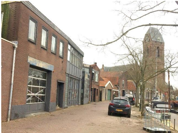
Voormalige wasserij aan de Noord IJsselkade

ontwikkeling aandacht verdienen wat betreft de inpassing in het straatbeeld en het beeld vanaf de Hollandse IJssel.