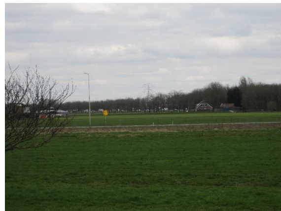
Locatie Burgemeester van Zwietenweg

In december 2020 heeft de gemeente gekozen voor de locaties Putkop en Burgemeester Van Zwietenweg.