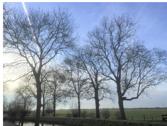
Rij volwassen essen langs de Lange Linschoten

De gemeente heeft de werkgroep om hulp gevraagd bij een actualisatie van het bestand waardevolle houtopstanden Montfoort. Dit bestand dat beschermd wordt door de Bomenverordening gemeente Montfoort, die toen mede op advies van de werkgroep is opgesteld dateert van 2009 en is nadien niet meer onderhouden en verdient dringend een update: een achterstallige verplichting van de verordening.