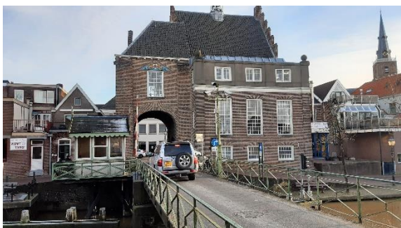
Beeldbepalend ensemble van brug en brugwachtershuisje

De IJsselbrug en het bijbehorende brugwachtershuisje hebben veel achterstallig onderhoud. De werkgroep heeft hierover met de gemeente overlegd en de gemeente heeft daarop Rijkswaterstaat (RWS) aangesproken. Brug en huisje zijn geïnspecteerd door RWS.