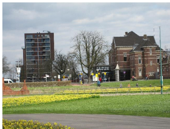
Hoge bebouwing bepaalt nu al de omgeving van het monumentale station

Bovendien staan in de nabijheid al hoge gebouwen: op het voormalige Monaterrein, het Defensie-eiland, en binnenkort ook in Middelland-Noord en Snellerpoort.