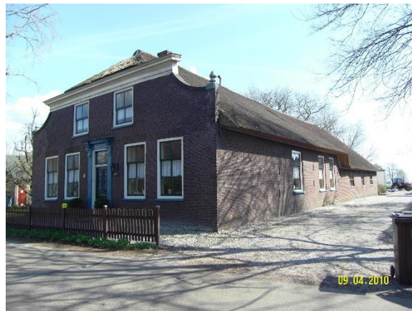
Boerderij Reijerscop 26

actueel en de veranderingen die in de loop der tijd plaatsvinden worden vastgelegd. Op aanvraag kunnen belangstellenden van ons archief gebruik maken.