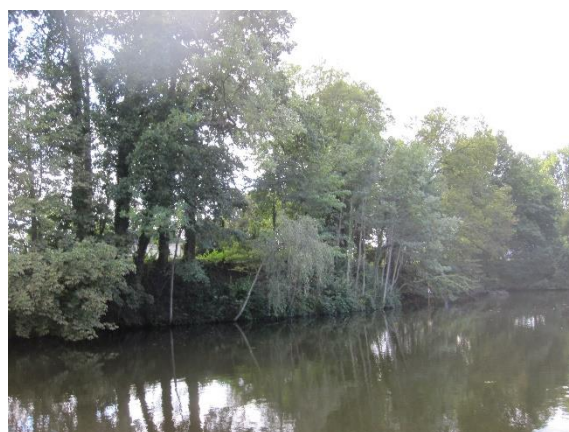
Talud van het bastion met de Algemene begraafplaats

Stichting Hugo Kotestein is het niet eens met het gemeentelijk plan om onderlangs de twee bolwerken bij de Hogewal een wandelpad aan te leggen. Om dit te realiseren moet een strook water van de binnengracht worden gedempt. De bastions en de binnengracht zijn rijksmonument. Om deze monumenten te wijzigen is een omgevingsvergunning en ook een rijksmonumentenvergunning nodig. De aanleg van de binnenwal begon in 1371. In volgende eeuwen is deze verbreed en verhoogd. Ooit had Woerden 1600 meter binnenwal, nu nog krap 100 meter. Hiervan heeft het deel tussen de twee begraafplaatsen - dit is ca. 30 meter - nog altijd de aanblik van een originele vestingwal.