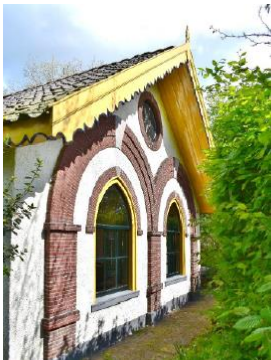
Zomerhuis van hofstede Batestein, gebouwd in neogotische bouwstijl

het voormalige koetshuis en de historie van diverse paden en waterwegen op het landgoed.