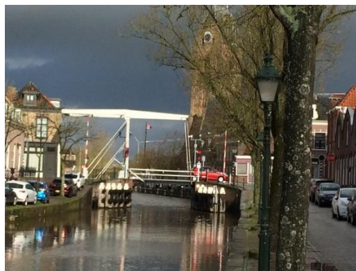
Cosijnbrug over de Hollandse IJssel

Nu HDSR het waterbouwkundig beheer van de Hollandse IJssel heeft, zijn in het voorjaar 2020 diverse belanghebbenden en geïnteresseerde partijen rond de tafel uitgenodigd om van gedachten te wisselen over de monumenten in en aan de IJssel (zoals bruggen, brugwachtershuisjes, jaagpaden, Waaiersluis), de flora en de fauna te land en in het water in verband met de recreatieve waarde van de gekanaliseerde rivier. Op 18 december publiceerde HDSR het definitief Kwaliteitskader gekanaliseerde Hollandse IJssel (met input van HK).