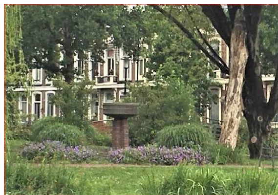
Herdenkingsschaal op een sokkel van baksteen

Stichting Hugo Kotestein doet al jaren zijn best om vier objecten, die ooit op het Defensie-eiland stonden teruggeplaatst te krijgen. De objecten dateren uit de tijd van het hier gevestigde militaire Centraal Magazijn. In 2020 is de hardstenen schaal, die in 1923 als onderdeel van een herdenkingszuil werd onthuld, teruggeplaatst op de groene punt van het eiland. Voor de hardstenen schaal moest er een nieuwe sokkel komen. De oorspronkelijke sokkel uit 1923 is in de loop van de tijd bij één van de verplaatsingen van de herdenkingszuil verloren gegaan.