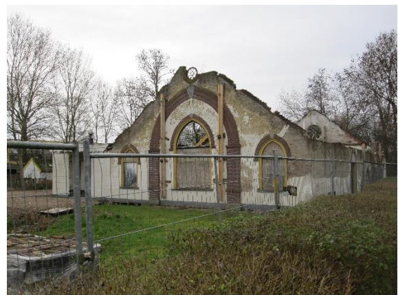
De voorbereiding van de restauratie is eind 2020 begonnen

Voor de herbouw van de in 2008 afgebrande boerderij Batestein is een aantal jaren geleden Stichting Hofstede Batestein opgericht. Door fondsenwerving probeert deze stichting geld bijeen te krijgen voor restauratie van de boerderij.