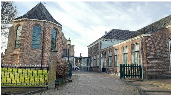
Blijft de doorgang tussen de Hervormde Kerk en De Wingerd open ?

hoogteverschil, waarmee de foyer niet hoeft te worden gebouwd én het verbouwen van het bestaande huis van Spruit aan de Nieuwe Zandweg waarmee nieuwbouw op het Weitje van Spruit overbodig wordt.