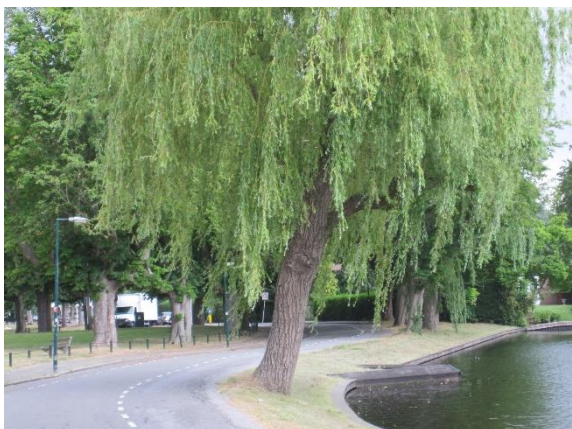
Gezonde bomen bij het Exercitieveld kunnen nog lang blijven staan

Stichting Hugo Kotestein wijst een parkeergarage onder het Exercitieveld af. Twee openbare parkeergarages in het Centrum is genoeg.