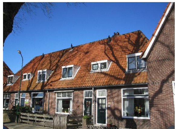
Voor karakteristieke bebouwing zijn richtlijnen nodig bij plannen voor zonnepanelen op het dak

De Stichting roept het Woerdense gemeentebestuur op vooral de open polders ten noorden van de Oude Rijn te sparen voor grootschalige energieopwekking, dus om hier geen hoge windmolens op te richten of uitgestrekte zonnevelden aan te leggen. Het landschap aan de zuidkant van de gemeente is al doorsneden door belangrijke vervoersassen. Windmolens en zonnevelden zullen daarom in de zone langs de A12 landschappelijk gezien minder schade aanrichten. Wel zal in de omgeving van de A12 uiterst zorgvuldig omgegaan moeten worden met bestaande cultuurhistorische en archeologische waarden.