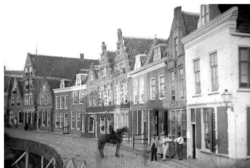
Havenstraat ca. 1880

Voor drie panden en vier gevels aan de Havenstraat zijn omgevingsvergunningen voor verbouwingen tot appartementen aangevraagd. Het betreft het eerste (wit gepleisterde) huis, het tweede trapgeveltje en de twee daarop volgende huizen, op deze 19e eeuwse foto. Discussie is onder andere, of het eerste huis dat in of omstreeks 1935 een etalage op de benedenverdieping gekregen heeft moet worden terug gebracht in de oorspronkelijke staat.