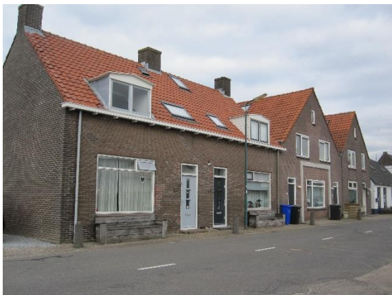
Deze huizen zullen moeten wijken voor de nieuwe Rembrandtbrug

Kort samengevat was het standpunt van onze stichting: planologisch gezien is de Rembrandtbrug de beste optie voor Woerden en cultuurhistorisch gezien de minst slechte oplossing.