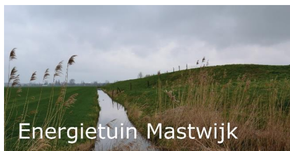
Voormalige vuilstort aan de Mastwijkdijk

De werkgroep participeert in gesprekken met NV Afvalzorg over het wijzigen van de voormalige vuilstort aan de Mastwijkdijk in een Energietuin. Bij dit onderzoek naar de haalbaarheid zijn ook de NMU (Natuur en Milieu Utrecht) en Wageningen Universiteit betrokken.