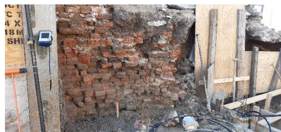
Fundering van de waltoren aan de stadsmuur bij de Achterdijk

In juni 2020 is bij de sloop van een woning aan de Achterdijk een stuk muur van één van de waltorens van de historische stadsmuur blootgelegd, een voor Nederland unieke vondst! Helaas heeft de eigenaar van het perceel hiervan geen melding gedaan bij de gemeente en is de vondst op een vroege zaterdagmorgen afgegraven. De werkgroep heeft daarop direct de gemeente op de hoogte gebracht en heeft gevraagd om een onderzoek.