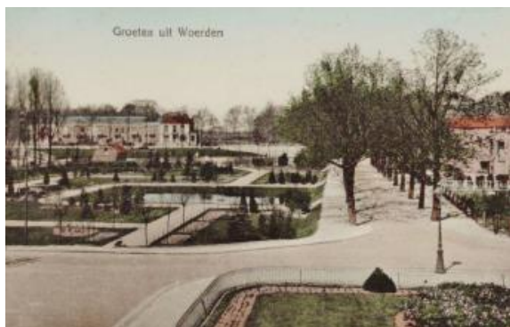
Spoorplantsoen op een prentbriefkaart uit ca. 1914

Over het Spoorplantsoen en de omgeving van het NS-station is door Piet Brak historische informatie verstrekt. Dit betrof: de brug over de Jaap Bijzerwetering, de losplaats van de NS aan de Singel, de wegen tussen Woerden en Linschoten en het Spoorplantsoen, dat oorspronkelijk veel groter was dan nu.