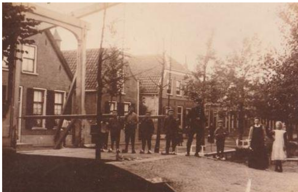
Dorpskern Kamerik met veldwachter en dorpsjeugd. +/- 1910. De boerderij links op de foto is gesloopt. Hier loopt nu de weg naar de supermarkt en de achtergelegen woonwijk.

Aan een tweetal nieuwe bewoners van de dorpskern is historisch fotomateriaal van hun woning aangeleverd. De werkgroep hoopt zo te bevorderen dat bij onderhoudswerk aan hun pand de oorspronkelijke situatie zo veel mogelijk behouden blijft.