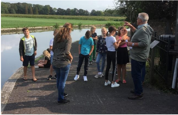
Kinderen op Jaagpad

Op de Open Monumentendag zaterdag 13 september werd mede als gevolg van Covid 19 het programma beperkt tot een rondleiding waarvoor men zich vooraf moest inschrijven. Hierdoor kon op relatief eenvoudige wijze worden voldaan aan de goedgekeurde protocollen met betrekking tot de organisatie van Open Monumentendag. De rondleiding behelsde een rondgang langs een aantal monumenten en het jaagpad in het centrum van het dorp. Tijdens deze rondleiding werden de N.H. en R.K. Kerk bezocht. De rondleiding eindigde bij het Tuinhuis 't Spijck in de tuin van Huize Harmelen. Mede met behulp van het mooie weer was er bij het tuinhuis een geanimeerde afsluiting met koffie/thee en iets lekkers. Aldaar kon door stakeholders (wethouder, Stichting tot Behoud van Tuinhuis 't Spijck, Stichting Open Monumentendag Woerden, Werkgroep Hugo Kotestein Harmelen) informeel worden overlegd over de toekomst van dit prachtige, met welhaast aan zekerheid grenzende waarschijnlijkheid, aan Zocher toe te schrijven monument.