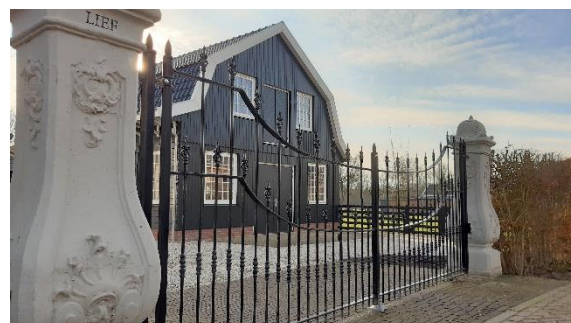
De gerestaureerde toegang van boerderij Liefhoven

Helaas verliest de gemeente daarmee wel één van haar gemeentelijke monumenten.